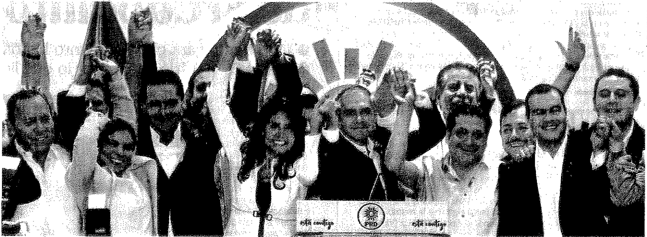
Con el apoyo de corrientes partidistas, gobernadores y el jefe de Gobierno de la CDMX, Alejandra Barrales, presidenta del PRD, anunció el frente.