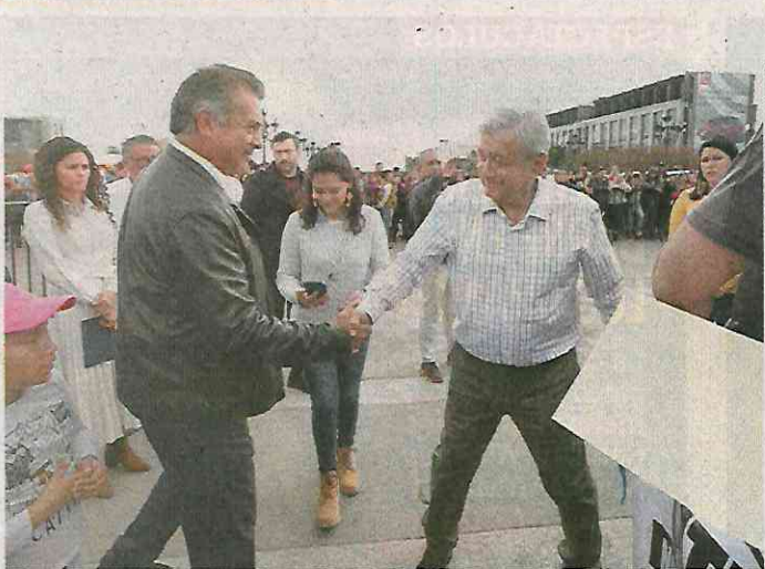
Jaime Rodríguez y Andrés Manuel López Obrador