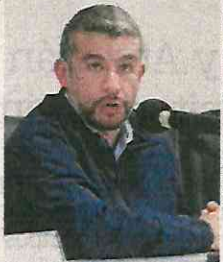
FERMANDA ROJAS, EL UNIVERSAL

En medio de una gran incertidumbre, los directores de diversos órganos administrativos del Congreso de la Ciudad de México tuvieron que recoger sus cosas y desocupar sus oficinas, luego de que les fueron pedidas sus renuncias. Nos platican que la guerra entre los diputados de Morena por el control de dichos puestos llevó al partido a tomar la decisión de correr a los actuales funcionarios, para nombrar a nuevos y quizá ratificar a algunos. Lo que verdaderamente llama la atención es que, nos aseguran, será la Comisión de Honor y Justicia de Morena la que se encargue de designar a los funcionarios del Congreso.