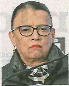
Rosa Icela Rodríguez