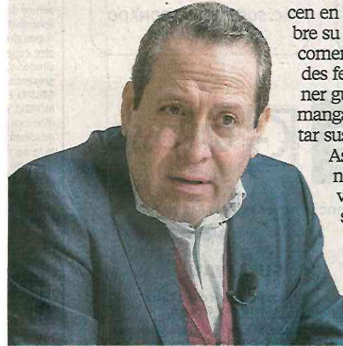
Eruviel Ávila Villegas

Así como está la administración federal, más valdría tomar sus previsiones ante cualquier investigación que le quisieran iniciar.