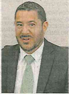
Martí Batres Guadarrama