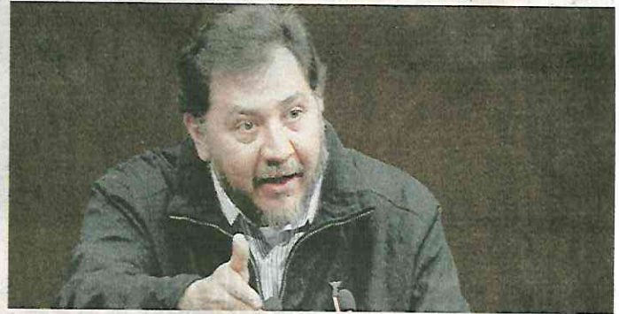
Gerardo Fernández Noroña

Los que de plano no tuvieron límites en sus labores de espionaje fueron los gobiernos priistas por medio de la Dirección Federal de Seguridad (DFS) y la Dirección de Investigaciones Políticas y Sociales (DIPS), que no les bastó con vigilar a políticos, cantantes y actores. Ahora se conoce que también un astronauta estuvo bajo su lupa. Fuentes al interior del Archivo General de la Nación nos detallan que Rodolfo Neri Vela , el primer astronauta que dio este país, también fue un objetivo de los aparatos de espionaje, por lo que ya se elabora un expediente con los reportes de inteligencia que elaboraron los elementos de las agencias, que abarcan del 22 de julio al 21 de diciembre de 1985 —es decir, antes y posteriormente de que el astronauta realizara dos caminatas por el espacio— y que suman 28 fojas con esta información.