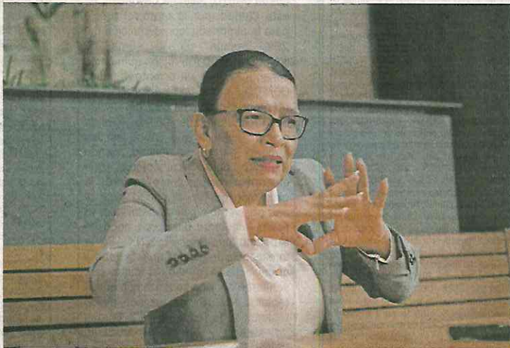
Rosa Icela Rodríguez Velázquez