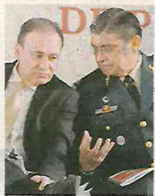
Alfonso Durazo y Luis Cresencio Sandoval

En su conferencia de prensa de ayer, el presidente Andrés Manuel López Obrador tiró una "bola lenta" y dejó a su gabinete de Seguridad que diera un informe a la opinión pública sobre la estrategia en la materia y sus resultados, a 10 meses de que inició la presente administración. Así, el secretario de Seguridad Pública Alfonso Durazo se despachó con una larga presentación y con estadísticas en las que destacó que en los niveles de violencia hay un "punto de inflexión" que "no es para festejar".