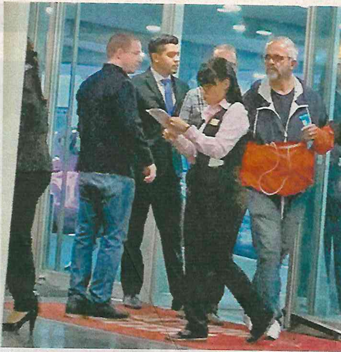
Ricardo Anaya, en el Teatro de los Insurgentes

Nos informan que 160 diputados de todas las fuerzas políticas, pero sobre todo de Morena, le enviaron un escrito a los coordinadores parlamentarios para "reorientar" el gasto hacia los 10 estados más pobres del país, entre los que se encuentran Oaxaca, Guerrero y Chiapas. Nos dicen que hay gran preocupación pues los recursos para los fondos Regional, Metropolitano y Pueblos Indígenas fueron disminuidos drásticamente para el 2020. Pero nos hacen notar que en el proyecto de Presupuesto, quienes sí se verán beneficiados son los banqueros, pues en la partida "Erogaciones para Programas de Apoyos a Ahorradores y Deudores de la Banca", se les darán más de 44 mil millones de pesos. Por esto los diputados inconformes recuerdan que el lema del líder de la 4T, Andrés Manuel López Obrador , es: "primero los pobres" y no "primero los banqueros".