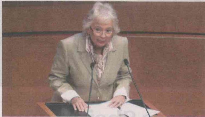
Olga Sánchez Cordero

Nos cuentan que organizaciones de la sociedad civil acudirán el próximo martes al Senado de la República para poner sobre la mesa el tema de asesinatos de periodistas y defensores de derechos. La idea es ejercer presión en los legisladores para que mejoren el Mecanismo de Protección que defiende a ese sector, aunque también trabajar para que mejoren las condiciones de seguridad en las que los reporteros y los defensores realizan su labor. De momento las asociaciones civiles cuentan con el apoyo de los senadores Emilio Álvarez Icaza y Nestora Salgado , aunque nos hacen saber que en los próximos días esperan sumar a más funcionarios a su causa.