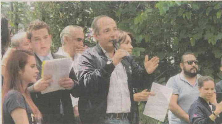
DEBECIA JIMÉNEZ EL UNIVERSAL

grupos siempre andan armados y las Brigadas de Vigilancia Comunal no pueden hacerles frente.