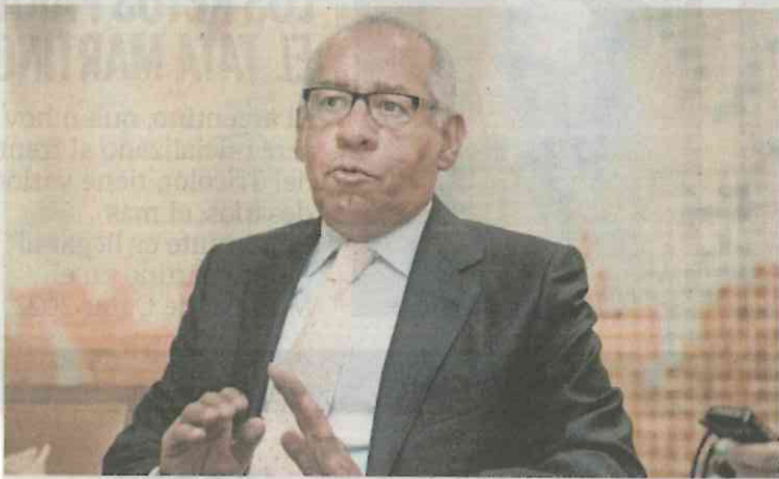
Ignacio Morales Lechuga, ex procurador

Como un yunque se cayeron las acusaciones de uno de los testigos en el caso de Joaquín Guzmán Loera , alias El Chapo , quien señaló al ex procurador general de la República, Ignacio Morales Lechuga , de haber recibido sobornos del narcotráfico. Jorge Milton Cifuentes Villa , testigo protegido de la DEA, hace referencia a hechos delictivos en México en el año de 1995 y aseguró que en esa época sostuvo una "relación corrupta" con Morales Lechuga quien afirmó era el procurador general de la República. Sin embargo, el narcotraficante nunca se enteró de que don Ignacio fue titular de la PGR de mayo de 1991 a enero de 1993 y que en 1995 no solamente no era procurador, sino que estaba del otro lado del Océano Atlántico sirviendo como embajador de México en Francia, por cierto, el propio gobierno francés le otorgó en 2014 la "Condecoración de Oficial de la Legión de Honor", por su contribución al estrechamiento de la amistad franco-mexicana, en parte por su trabajo como embajador. Así que los dichos del narcotraficante y testigo protegido se hundieron como un yunque.