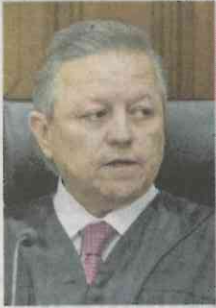
GERMÁN ESPINOSA. EL UNIVERSAL