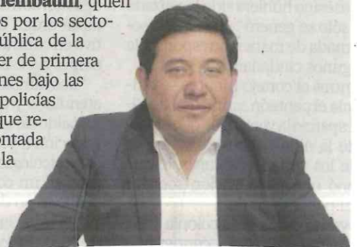
José Carlos Acosta

Nos comentan que el alcalde de Xochimilco, el morenista José Carlos Acosta , quiere de regreso a la policía montada para poder entrar a las zonas montañosas de esta demarcación del sur, pues los vehículos no pueden ingresar por los caminos de pueblos como los de San Mateo Xalpa y San Francisco Tlalnepantla así como un módulo en Santiago Tulyehualco. Nos platican que esto lo planteó el edil a la jefa de Gobierno, Claudia Sheinbaum , quien sigue sus recorridos por los sectores de seguridad pública de la CDMX para conocer de primera mano las condiciones bajo las cuales laboran los policías capitalinos. ¿Será que regresa la policía montada como la charra en la Alameda Central?