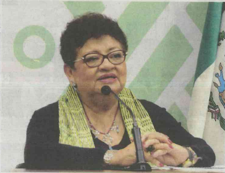
Ernestina Godoy Ramos