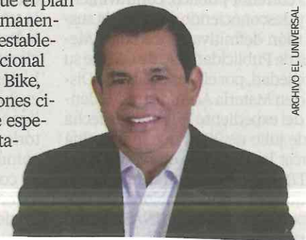
Juan Hugo de la Rosa

Apenas hace unos días el ayuntamiento de Nezahualcóyotl anunció un programa emergente para que los policías municipales realizaran rondines de vigilancia en los 100 cuadrantes de la ciudad debido a la escasez de gasolina, pero el proyecto continuará. Nos dicen que hoy el alcalde perredista, Juan Hugo de la Rosa , dará a conocer que el plan se aplicará de manera permanente y se basarán en lo que establece la organización internacional de la Policía de Mountain Bike, así como otras organizaciones civiles de ciclismo. Hay que esperar a ver si los oficiales estarán de acuerdo.