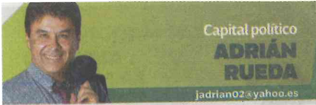
Capital político ADRIÁN RUEDA