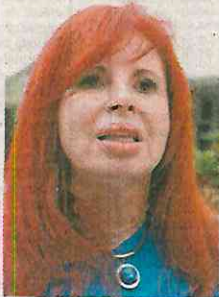
Layda Sansores San Román