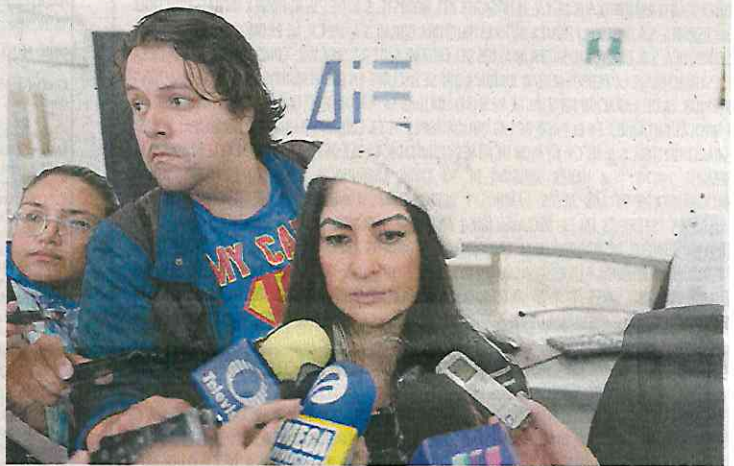
Dylcia Samantha Espinosa

Menudo lío tiene la fiscal mexiquense para la Atención de Delitos Vinculados a la Violencia de Género, Dylcia Samantha Espinosa de los Monteros , con el tema de los feminicidios en la entidad, que se ubica en segundo lugar a nivel nacional, con 109 casos contabilizados en lo que va del año. Algunas organizaciones sociales ya se inconformaron con su labor, pues dicen que aparte de este grave problema no ha puesto atención en el riesgo que representa a las mujeres viajar en el transporte público, además de que no ha realizado un mapeo sobre los sitios peligrosos en la entidad para poner atención en ellos. La situación en la entidad mexiquense está más que complicada.