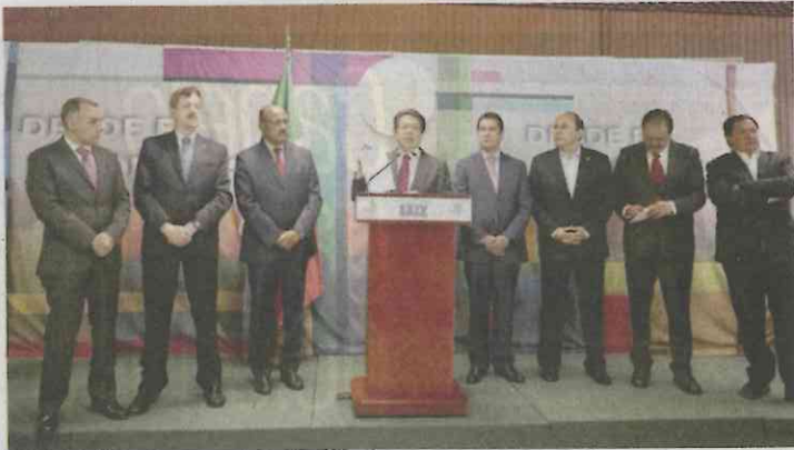
Los coordinadores parlamentarios de los diputados