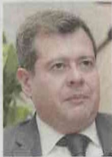
José Ramón Amieva