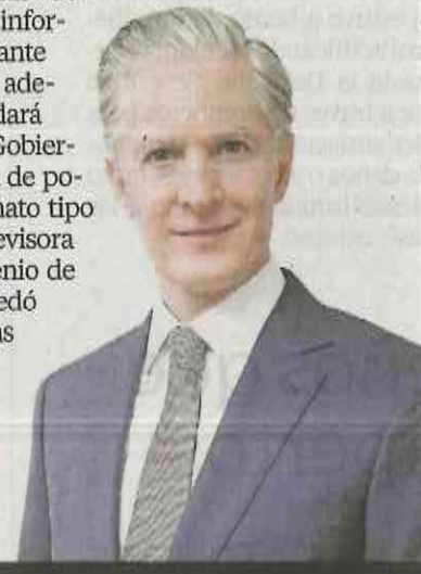
Alfredo del Mazo Maza

Nos comentan que el gobernador del Estado de México, el priísta Alfredo del Mazo Maza , dará un vuelco de 180 grados al formato del informe de actividades que tuvo durante su primer año de gobierno. Nos adelantamos que el 21 de septiembre dará sólo un mensaje en Palacio de Gobierno, al cual se prevé la asistencia de pocos invitados. Así es que el formato tipo talk show transmitido por la televisora estatal que se empleó en el sexenio de Eruviel Ávila , su antecesor, quedó atrás, al igual que las ceremonias en el Teatro Morelos, donde acudían miles de invitados. Son otros estilos, nos dicen.