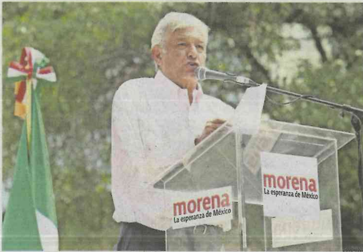
Andrés Manuel López

Veremos, nos dicen, cuánto dura la luna de miel.