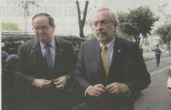
Enrique Graue a su llegada, antier, al CCH Azcapotzalco

Desde el equipo del doctor Enrique Graue consideran que el rector de la UNAM ganó el primer round a los porros que han detonado con su acción violenta el repudio y un movimiento estudiantil que exige el fin a la inseguridad en las escuelas y facultades de la máxima casa de estudios. Nos comentan que los asesores de don Enrique evaluaron los riesgos de estar en la asamblea del CCH Azcapotzalco, por la presencia de provocadores profesionales, pero el rector apostó por el diálogo con cerca de 500 estudiantes que desde finales de agosto tienen tomado el plantel. El resultado no pudo ser mejor: los jóvenes discuten regresar a clases en los próximos días.