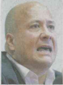
Enrique Alfaro Ramírez