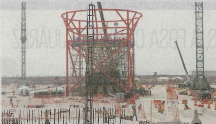
Obras del nuevo aeropuerto

Nos dicen que en los próximos días el equipo cercano al presidente electo Andrés Manuel López Obrador realizará una visita a la obra del Nuevo Aeropuerto Internacional de la Ciudad de México (NAIM) en Texcoco con la finalidad de ver los avances y las afectaciones que existen en las comunidades aledañas. Nos comentan que aún no está confirmada la participación de don Andrés, pues realizará una gira por el sureste del país. Sin embargo, nos hacen ver, que el mensaje de los miembros del equipo de AMLO para los pobladores es que el mandatario electo no decidirá si el aeropuerto se construye en esa localidad o en la actual base aérea militar de Santa Lucía, que esa será una decisión que tomen los ciudadanos y que él la respetará. ¿Será que el presidente electo está preparando el terreno con los opositores en caso de que la consulta se incline por seguir la obra en Texcoco y tenga que dar malas noticias a quienes están en contra del proyecto y apoyaron su campaña con la seguridad de que lo cancelaría al llegar al poder?