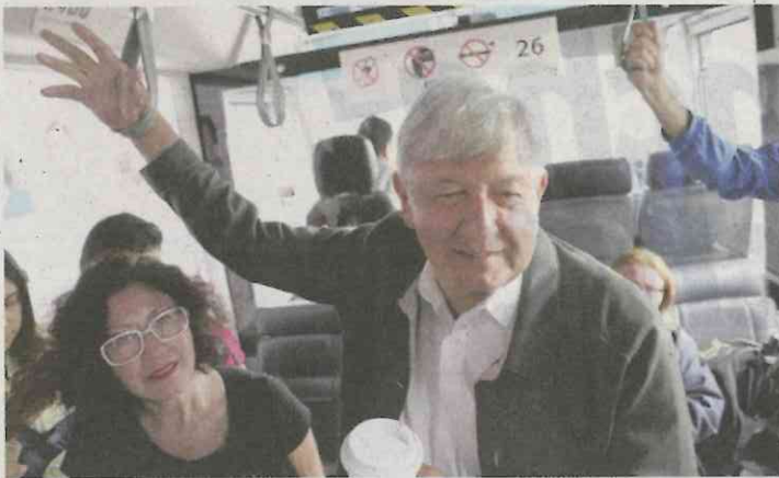
Andrés Manuel López

cuatro vendedores a quienes un funcionario estatal les pidió facturas al doble. Así, nos explican, con las pruebas de lo anterior en su poder, el morenista pidió averiguar presuntos actos de corrupción y recalcó que la ZEE no va, ante lo cual, Núñez Jiménez salió al paso para pedir a la fiscalía estatal y a la Contraloría investigar la denuncia. Algunos nos dicen, se preguntan si en verdad el actual mandatario nada sabía al respecto.