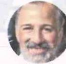
José A. Meade

Gran fichaje hizo la Comisión Global de Adaptación sobre el Cambio Climático de los Países Bajos. Incorporó al ex candidato presidencial del PRI, José Antonio Meade, al equipo de representantes de 17 países que ayudan a naciones vulnerables a lidiar con este fenómeno, y elaborará un informe para la Cumbre del Clima de la ONU en septiembre del próximo año.