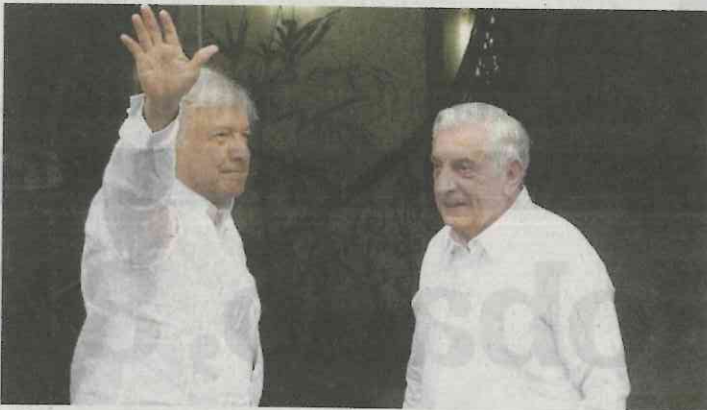
López Obrador y Arturo Núñez, ayer en Villahermosa

El presidente electo Andrés Manuel López Obrador acortará su gira de agradecimiento por el país para enfocarse en los proyectos que aún le faltan por delinear de cara a su toma de posesión el 1 de diciembre. Originalmente, nos comentan, la gira estaba prevista para concluir unos días antes del 1 de diciembre, pero se acortó más de un mes, por lo cual concluirá el domingo 21 de octubre. Curiosamente, son esos dos los estados donde al tabasqueño le sería más difícil sacarse una foto sonriente: en el caso de Puebla, por el conflicto postelectoral que todavía vive la entidad y, en el caso de Veracruz, porque el gobernador Miguel Ángel Yunes le profirió no pocos insultos durante la campaña presidencial.