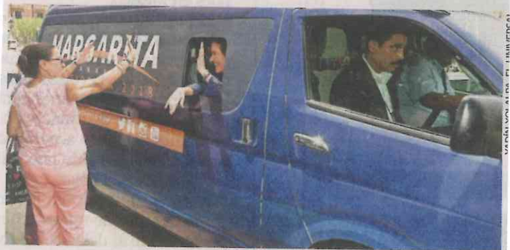
Margarita Zavala, en campaña, el domingo pasado

En el equipo de campaña de Margarita Zavala , analizan los efectos de haber volado este domingo en jet privado para su gira por Tampico y Matamoros en el estado de Tamaulipas, que costó cerca de un cuarto de millón de pesos. Nos cuentan que se tomó la decisión de utilizar, lo menos posible y solamente cuando sea indispensable, aeronaves privadas o taxis aéreos. Nos dicen que buscan tener logísticas más accesibles y la prioridad será mantenerse como hasta ahora: en trayectos en vuelos comerciales y con los pies bien puestos en la tierra.