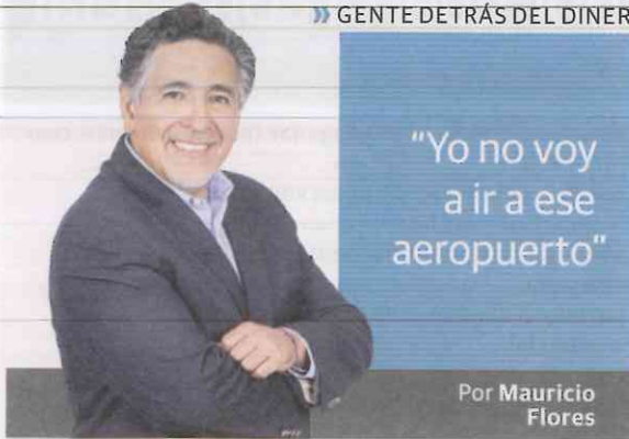
Por Mauricio Flores