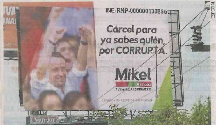
Propaganda de la campaña de Mikel Arriola