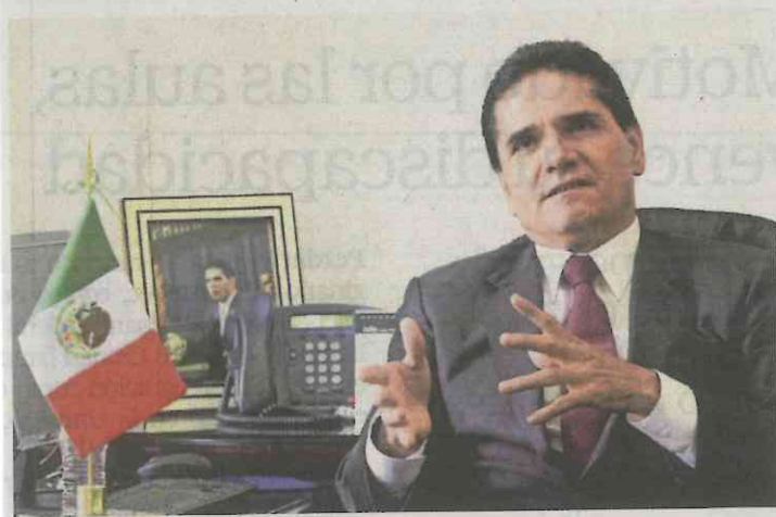
Silvano Aureoles Conejo