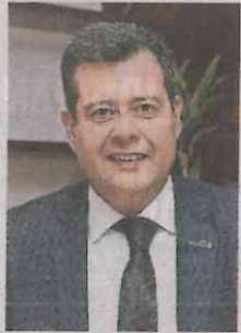
José Ramón Amieva

En medio del incremento en la violencia que se registra en la Ciudad de México, el jefe de Gobierno, José Ramón Amieva Gálvez , fue contundente; a los mandos les otorgó un voto de confianza e incluso se dijo dispuesto a apoyarlos en todo lo que requieran, pero, a cambio, exigió cumplan con su trabajo. Amieva también aprovechó, hace unos días, para enviar un mensaje al resto de los elementos: que no se ponga en duda el trabajo de los superiores, pues lo único que se genera es desacreditar a las instituciones. Nos cuentan que el mandatario tiene claro