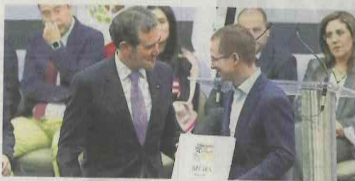
Lorenzo Córdova y Ricardo Anaya, el domingo, en el INE

Con tremenda celeridad, el Instituto Nacional Electoral, encabezado por el consejero Lorenzo Córdova , determinó otorgar medidas cautelares al candidato presidencial panista, Ricardo Anaya , frente a un desplegado publicado por el PRI en distintos diarios del país para señalar al joven político por realizar acciones de lavado de dinero y de enriquecimiento ilícito. En unos cuantos días, nos comentan, el INE envió requerimientos a los medios de comunicación para que le informaran quién o quiénes habían ordenado la inserción del desplegado publicado entre el jueves y el viernes de la semana pasada, y, por supuesto, quién o quiénes lo habían pagado. Y, en cuestión de días, los integrantes de la Comisión de Quejas y Denuncias del INE ordenaron a la dirigencia priísta la suspensión del desplegado y que se abstenga de contratar otros espacios publicitarios. El trato dispensado a Anaya contrasta con otras quejas y con la recepción que le dieron el domingo en el instituto para la solicitud de registro como aspirante a Los Pinos. Y si no, pregúntele usted a Margarita Zavala , a quien apenas le dieron acceso a un pequeño espacio después de realizado el trámite. ¿Córdova se viste de azul?