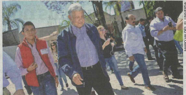
AMLO, con militantes de Morena en Querétaro

Esta semana que arrancará será definitiva para varios priistas, porque sabrán si entran o no a las listas de plurinominales al Congreso. Pero sobretodo por el lugar de la lista en que quede cada quien. Por lo pronto ya hay varios nombres que circulan para la Cámara de Diputados y el Senado. Pero las listas se están afinando y ya nada más queda una semana para que se haga el destape y se vea finalmente quién se cuele y quién queda fuera. Pero el PRI se inquietó por los nombres que andan circulando por todos lados, por lo que ayer oficialmente dijo que si alguien ve algunas listas, pues son falsas.