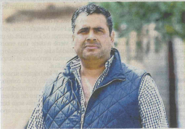
Alfredo Lozoya Santillán

sobre el caso, nos dicen, se da a conocer luego de que el viernes un juez de Control consideró que Villagrán puede enfrentar su proceso en libertad, lo que de inmediato puso en alerta a don Saúl, quien al temer por su vida ha solicitado protección de la fiscalía, pues si ya se atrevieron a dañarlo física y mentalmente una vez, no está de más cuidarse las espaldas.