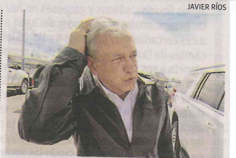
López Obrador ya olfatea el olor de la derrota.

quienes cierran los ojos y los oídos. AMLO dice que habrá violencia social si lo derrota la democracia. Y es que ya olfatea el olor de la derrota.