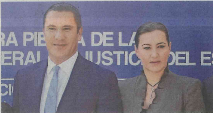
Rafael Moreno Valle y su esposa Marha Erika Alonso