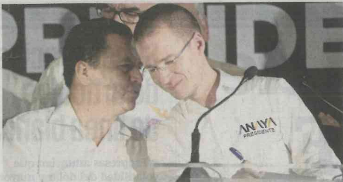
Ricardo Anaya Cortés