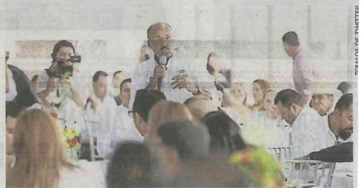
René Juárez Cisneros, presidente nacional del PRI