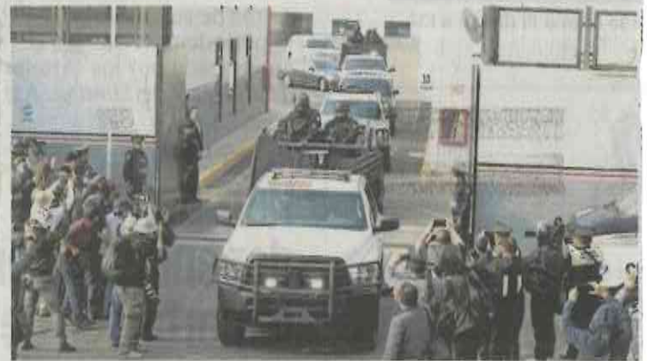
Convoy en el que se trasladó a "Roberto N" al Edomex.

Con el arranque del 2018, el equipo del presidente Enrique Peña Nieto prepara la primera gira internacional de su último año de gobierno. Nos adelantamos en la casa presidencial que el mandatario viajará en la segunda quincena de enero a Paraguay, para realizar una visita de Estado. A pesar de que hay varias giras internacionales en el tintero, nos comentan que en Los Pinos no hay confirmación de otra salida al exterior, al menos en el primer semestre del año. Todo indica que el jefe del Ejecutivo se mantendrá en el país para estar al tanto del proceso electoral, el más grande de la historia de México.