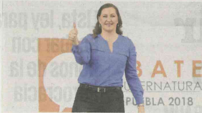
Martha Erika Alonso

La acción de inconstitucionalidad presentada por senadores de oposición contra la Ley Federal de Remuneraciones, el recorte de salarios, ha puesto en aprietos a la Suprema Corte de Justicia de la Nación. Nos explican que el expediente fue turnado al ministro Alberto Pérez Dayán , quien deberá analizar cuidadosamente si concederá o no la suspensión en la aplicación de la legislación. ¿Cuál es el efecto inmediato? Nos comentan que la decisión del ministro impactaría directamente en la confección del Presupuesto de Egresos de la Federación 2019. Ello, nos dicen, en razón de que si congela la ley, los diputados no podrían emitir un gasto federal con base en los lineamientos de la baja salarial, menor a los 108 mil pesos que gana el Presidente de México, y el ministro tendría que justificar y especificar bajo qué reglas se asignarán los recursos a ejercer el próximo año y los salarios de la burocracia mexicana. Todo un tema para alguien que ha manifestado su deseo de contender por la Presidencia de la Suprema Corte de Justicia de la Nación.