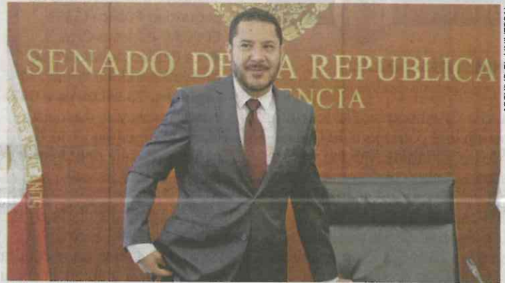
Martí Batres, presidente del Senado

Este miércoles la Comisión de Justicia de la Cámara de Diputados analizará la minuta con la que se crea la Fiscalía General de la República. Sin embargo, nos aseguran que este dictamen, al parecer no se aprobará al vapor, debido a que Morena quiere enviar un mensaje de que no será a golpe de mayorías como se aprueben las leyes. Nos comentan que la bancada que comanda Mario Delgado buscará que haya consenso en esta iniciativa. Nos adelantan que lo mismo ocurrirá con la Ley de la Consulta Popular y la Revocación de Mandato. Solo falta que esta actitud sea real, y no se quede en un buen deseo de fin de año.