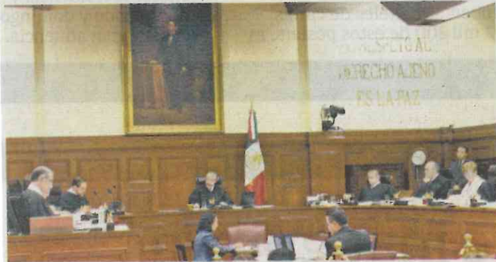
En enero, la elección de presidente de la Suprema Corte

Una vez que los poderes Ejecutivo y Legislativo tienen nuevos presidentes, ahora toca el turno del Poder Judicial. Hoy mismo arranca la carrera por la otra presidencia: la de la Suprema Corte de Justicia de la Nación. Los aspirantes cuentan con cinco días para presentar sus propuestas de trabajo y formalizar sus candidaturas de cara a la votación que se realizará en enero de 2019. Hasta ahora se sabe que cuatro ministros han manifestado de manera informal su intención de competir por la presidencia de la Corte, ellos son Alberto Pérez Dayán, Jorge Mario Pardo Rebolledo, Alfredo Gutiérrez Ortiz Mena y Arturo Zaldívar Lelo de Larrea . El nuevo Presidente de la Corte tendrá una gestión en la que deberá defender la independencia judicial y enfrentar el escenario en el que jueces y magistrados buscan no ver afectadas sus condiciones laborales por las políticas de austeridad. Habrá que estar pendientes para ver si el alto tribunal opta por una sucesión consensada o por una lucha en la que venza el que sume más votos y tenga menos vetos.