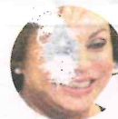
Elba Esther Gordillo

En el SNTE se despachan con el cucharón del pozole. Por ejemplo, la sección 15, del Estado de México, rifó seis automóviles, pantallas y artículos electrodomésticos en su fiesta de fin de año, la cual fue amenizada por el grupo Calibre 50. Nos dicen que hasta parece que regresó Elba Esther Gordillo a la cúpula del gremio. ¿O no?