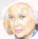
Olga Sánchez C.

En menos de dos meses, la Cámara de Diputados podría aprobar el uso recreativo de la marihuana. Es un tema en el que hay consenso, y se busca sacar una iniciativa común de las propuestas presentadas por la secretaria de Gobernación, Olga Sánchez; la diputada emecista Martha Tagle, y la bancada del PRD.