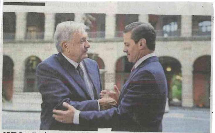
AMLO y Enrique Peña Nieto, ayer en Palacio Nacional

La confrontación entre el futuro senador morenista Martí Batres y el actual presidente de la Cámara Alta, el panista Ernesto Cordero , gana el primer plano a tres semanas del cambio de Legislatura. Nos dicen que ante las exigencias de don Martí —quien está apuntadísimo para ser designado presidente de la mesa directiva— para que no se entreguen estímulos económicos a funcionarios y asesores por su desempeño, don Ernesto emitió un comunicado en el que recuerda a quien llega que las facultades de la 63 Legislatura concluyen el 31 de agosto. El hecho es que Batres, pero también Ricardo Monreal , próximo coordinador de la banda de Morena, dan órdenes a diestra y siniestra. ¿Conviene esta hostilidad al presidente electo Andrés Manuel López Obrador ?