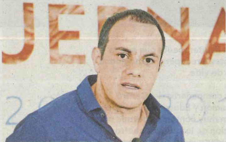
Cuauhtémoc Blanco Bravo

de Gobierno (siglo XIX), reconstruida por su papá, el primer gobernador electo en BCS en los años 80, pero quien no logró terminar los trabajos de restauración. Así, nos platican, sorprende que don Carlos, en lugar de seguir el legado, insista en establecer un “museo nice”, que hasta el INAH calificó como “aberrante”. ¡Qué pena!