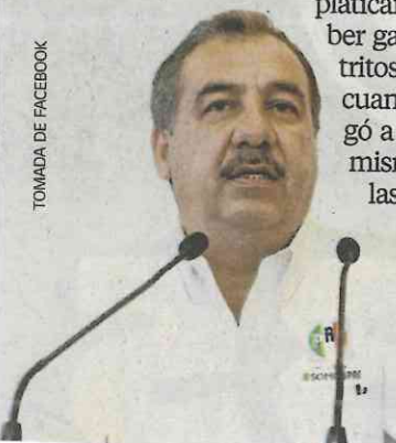
TOMADA DE FACEBOOK