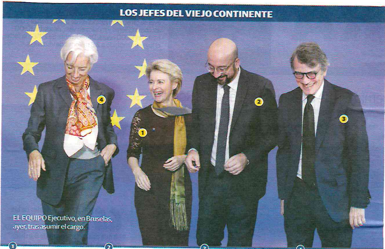
EL EQUIPO Ejecutivo, en Bruselas, ayer, tras asumir el cargo.