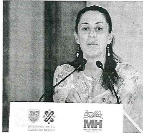
La jefa de Gobierno condenó el asesinato.