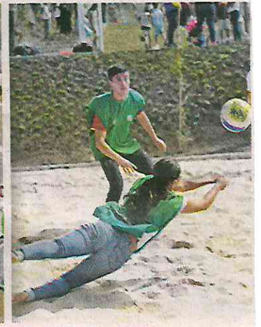
DE ESTRENO. El parque se ubica en Avenida del Imán número 263, Colonia Ajusco y beneficiará a 450 mil vecinos.