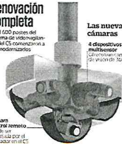
Cámara control remoto Puede ser maniobrada por el operador en el C5

3 mil 600 postes del sistema de videovigilancia del C5 comenzaron a ser modernizados