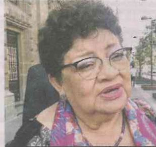
Ernestina Godoy, Procuradora capitalina

Espero que esto realmente sea un trabajo que nos lleve a una Fiscalía que sea un ejemplo a nivel nacional, a ser la mejor Fiscalía que desde la Ciudad pueda impactar en las otras fiscalías”.