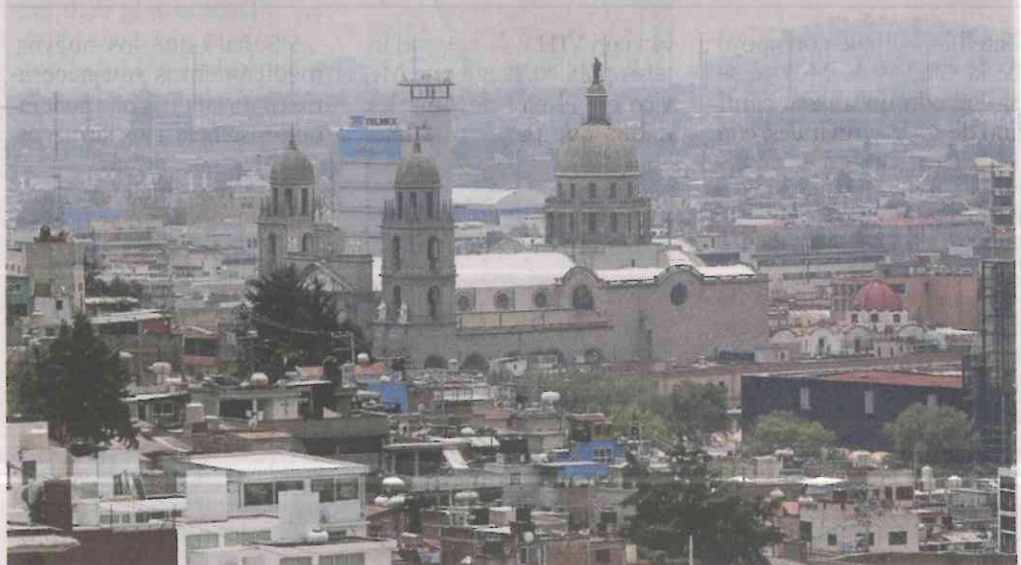
CIELO GRIS. Toluca, Estado de México, es una de las 20 ciudades del país que registró ayer los más altos niveles de contaminación del aire, según una medición internacional.