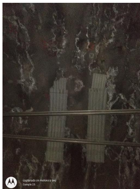
capturada en motorola one Ejemplo 25

Cadenamiento 28+498.509 Ubicación/Vía 1 Muro (M)/Losa Superior (LS) LS Ancho --- Altura --- Tipo de Esguimiento Goteo Constante Hora 11:59 Observaciones