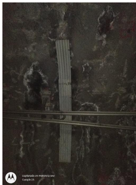
capturada en motorola one Ejemplo 25

Cadenamiento 28+489 al 28+487 Ubicación/Vía 2 Muro (M)/Losa Superior (LS) M Ancho --- Altura --- Tipo de Esguimiento Esguimiento Constante Hora 11:58 Observaciones