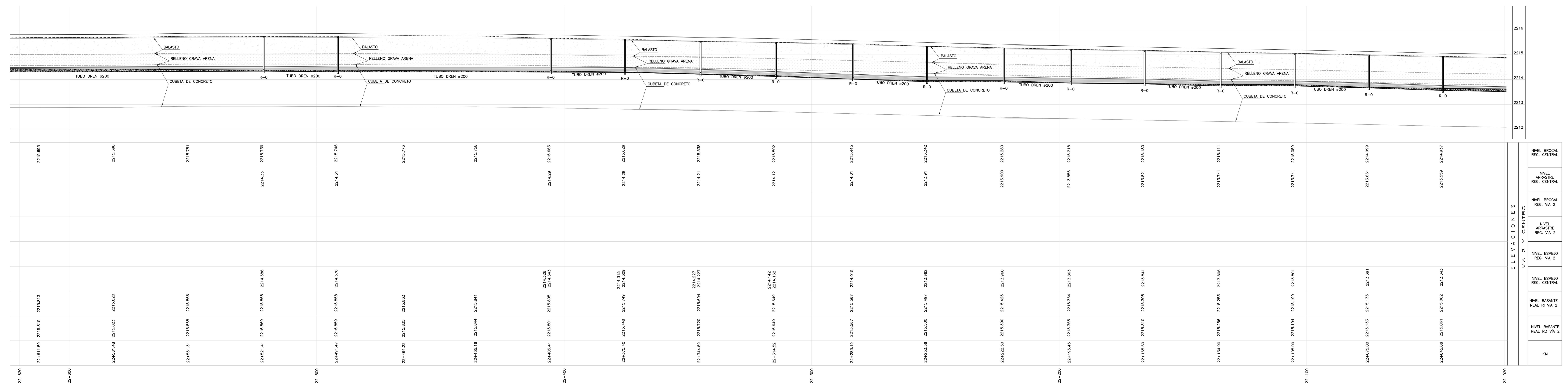
2 PERFIL DEL KM 22+020.00 AL KM 22+620.00 1 : 500 HORIZONTAL 1:50 VERTICAL