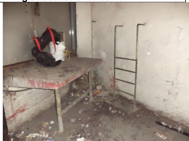
Fabricar escalera de peldaños para acceso al local 3 de ventilación.