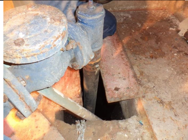
Sustitución de: mangueras; soportes para tuberías de descarga y arreglo hidráulico; tapas y marcos de registros