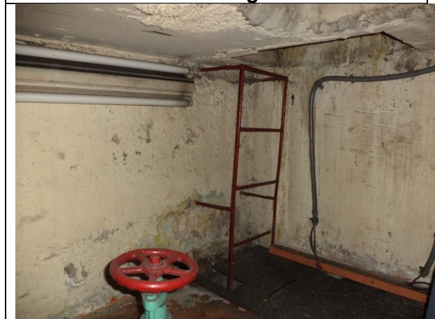
Sustitución de escalera, instalación de luminarias, resanado de muros, pintura general y canalización de cableado tuberías conduit.