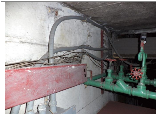
Sustitución de cableados de alimentación trifásica a 220 volts, e hilo de tierra desde la subestación hasta el tablero de control y fuerza.