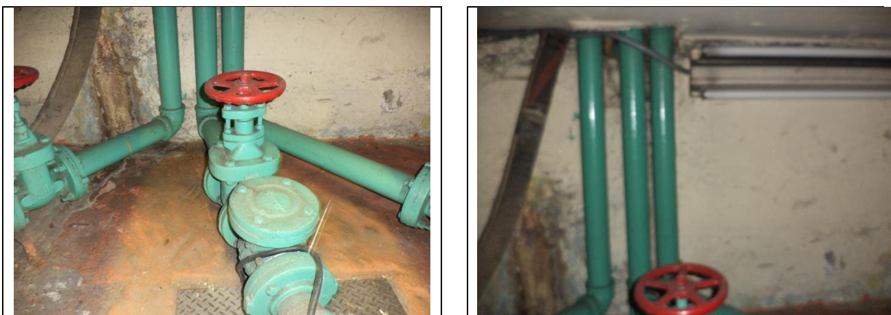
Sustitución de las tuberías de descarga y arreglo hidráulico

NOTA: aforo de aportación de agua al cárcamo PENDIENTE