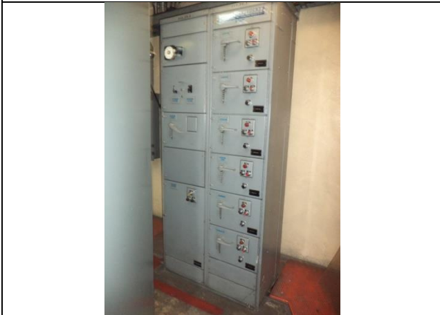
Sustitución del centro de control de motores y transferencia automática en la subestación eléctrica, instalando un tablero de distribución en donde se encuentren todos los interruptores de los equipos de bombeo de la estación "TABLERO F", con alimentación PREFERENCIAL.