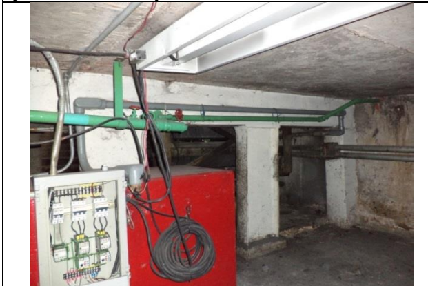
Sustitución de los cableados de alimentación desde el cuarto de tableros hasta el tablero de control y fuerza, trifásica a 220 volts, e hilo de tierra así como tuberías conduit e iluminación.