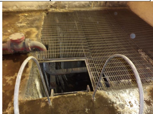
Sustitución de escalera marco y rejilla Irving de acceso al cárcamo