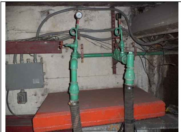
Sustitución de arreglo hidráulico, tuberías de descarga y mangueras de descarga.

NOTA: aforo de aportación de agua al cárcamo, PENDIENTE