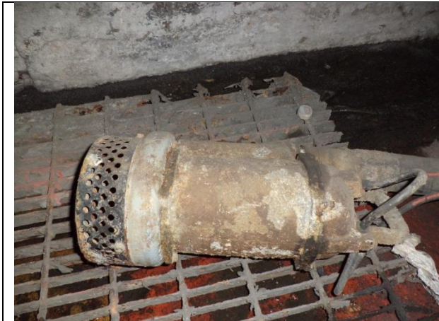
Sustitución de las dos motobombas