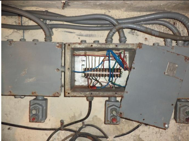
Sustitución de tablero de control y fuerza