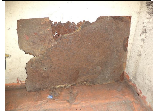
Sustitución de: soportes para tuberías de descarga y arreglo hidráulico; tapas y marcos de registros