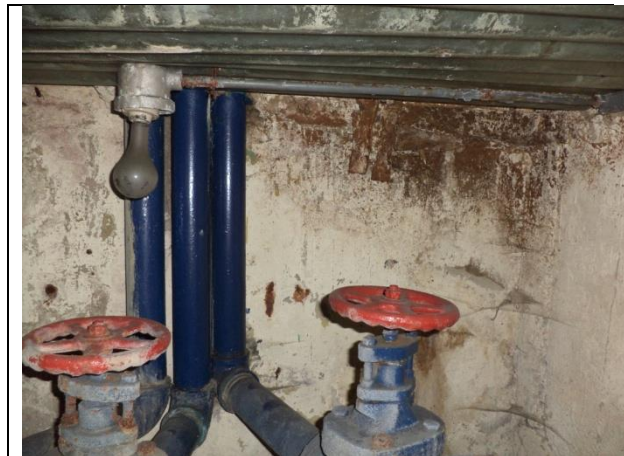
Sustitución de las tuberías de descarga y arreglo hidráulico