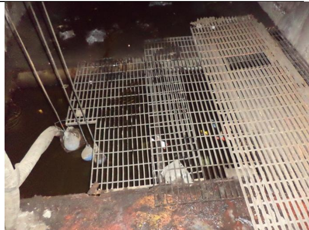
Sustituir marcos y rejillas Irving y elaborar trampa de solidos en cárcamo.