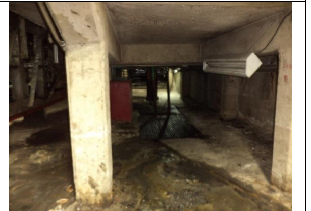
Canalización de escurrimientos y filtraciones hacia la trampa de solidos del cárcamo.