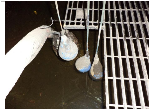
Sustitución de electrodos de acero inoxidable.