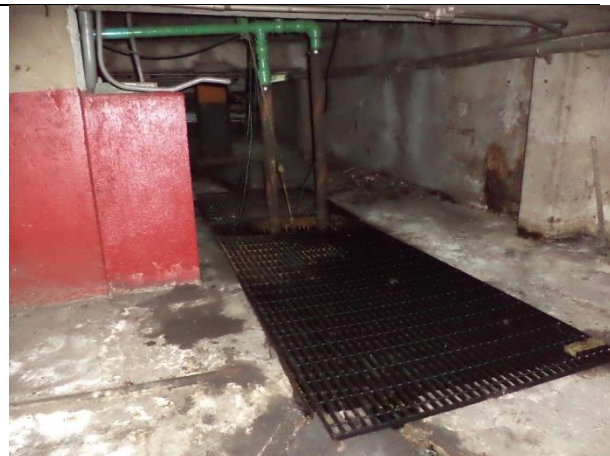
Sustituir marcos, rejilla Irving y elaborar trampa de solidos.