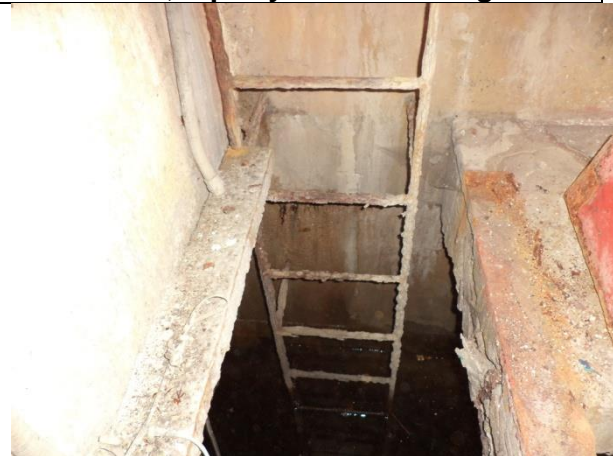
Sustitución de escaleras del anden al bajo anden y del bajo anden al interior del carcamo, colocación de marcos y tapas de registro, revoque y pintura general.