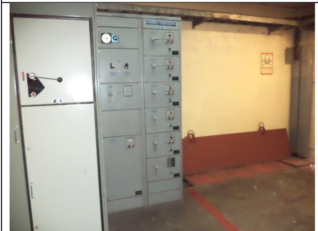
Sustitución del centro de control de motores y transferencia automática en la subestación eléctrica, instalando un tablero de distribución en donde se encuentren todos los interruptores de los equipos de bombeo de la estación "TABLERO F", con alimentación PREFERENCIAL.