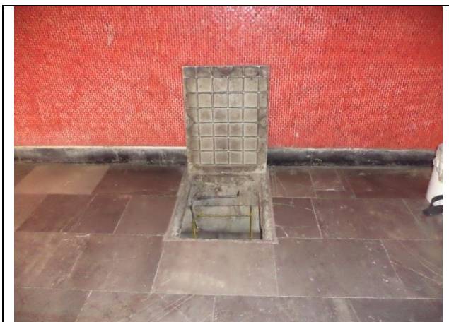
Sustituir marcos y tapas de acceso al cárcamo.

NOTA: aforo de aportación de agua al cárcamo es solo escurrimientos y filtraciones, pero durante la época de lluvias se incrementa considerablemente