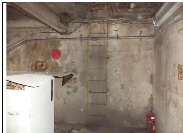
Sustitución de escalera marina de acceso a la sala de máquinas, instalando escalera tipo rampa.