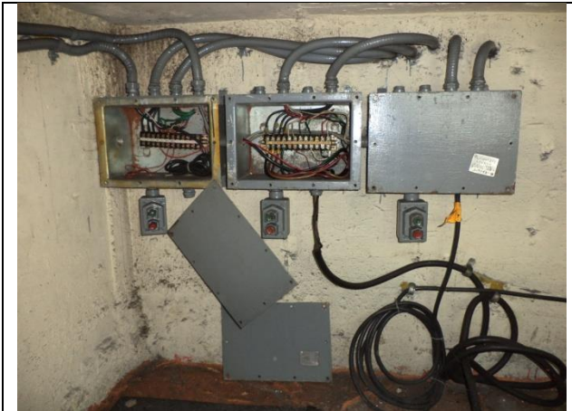
Sustitución de tablero de control y fuerza