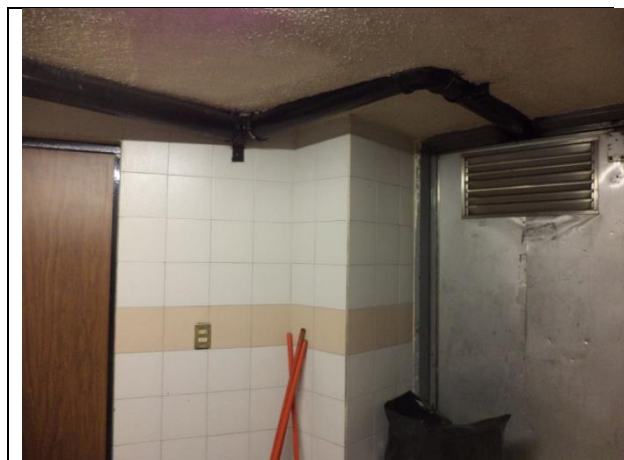
Sustitución de las tuberías de descarga y arreglo hidráulico