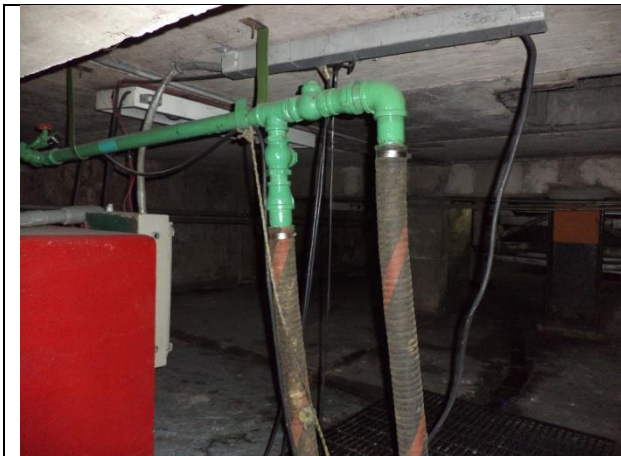
Sustitución de arreglo hidráulico, mangueras de descarga y soporteria