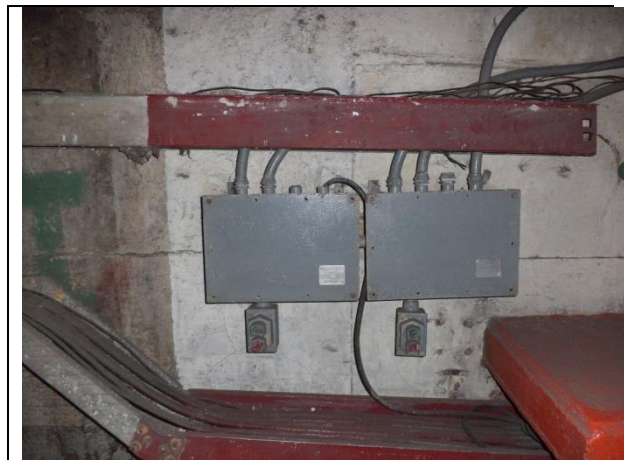
Sustitución de tablero de control y fuerza