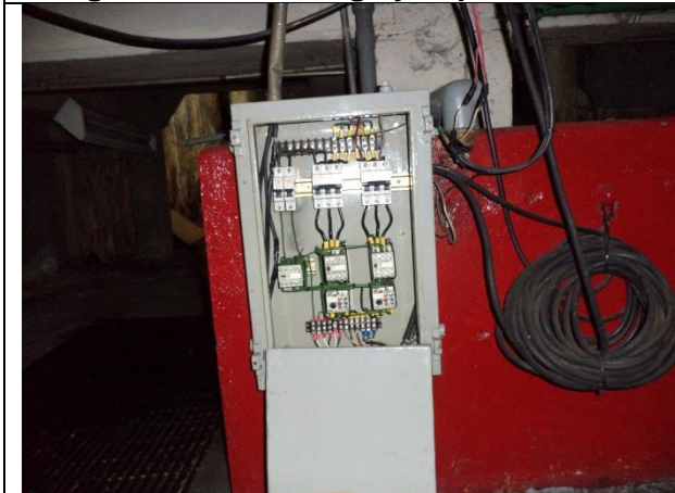
Sustitución del tablero de control y fuerza. Ubicándolo en zona alta del cuarto de maquinas para facilidad de mantenimiento y evitar daños por inundación.