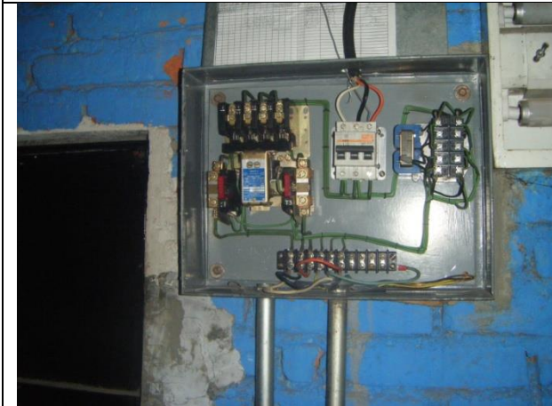
Sustitución de tablero de control y fuerza