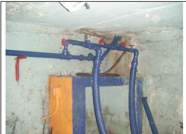
Sustitución de las tuberías de descarga y arreglo hidráulico

NOTA: aforo de aportación de agua al cárcamo escurrimiento , pero durante la época de lluvias se incrementa considerablemente