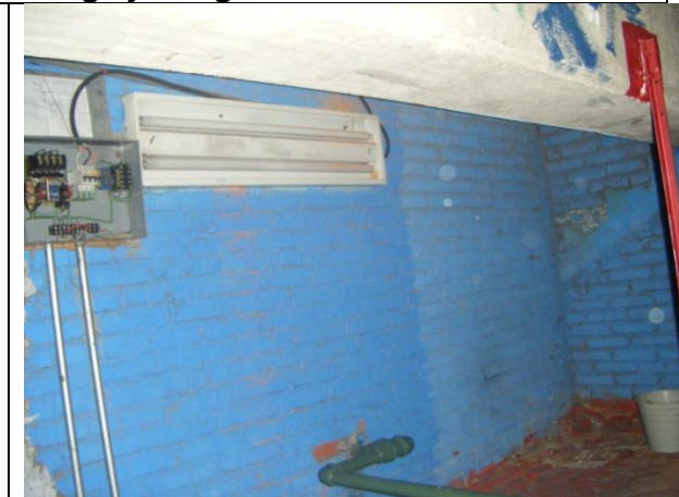
Instalación de dos gabinetes de alumbrado de 2 x 32 watts