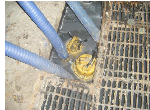
Instalación de motobombas