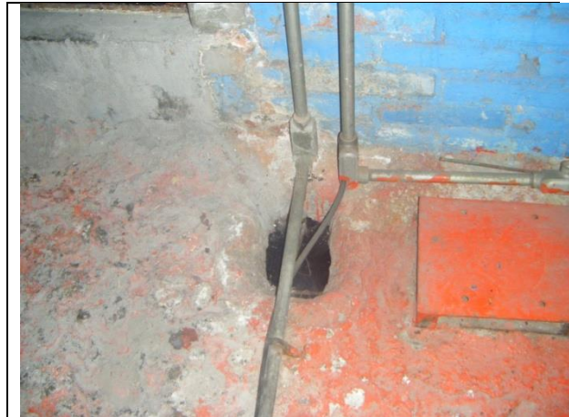
Sustitución de las tuberías conduit en la sala de máquinas.