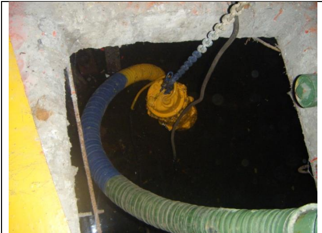
Sustitución de: motobombas, mangueras; soportes para tuberías de descarga y arreglo hidráulico; marcos y rejilla irving