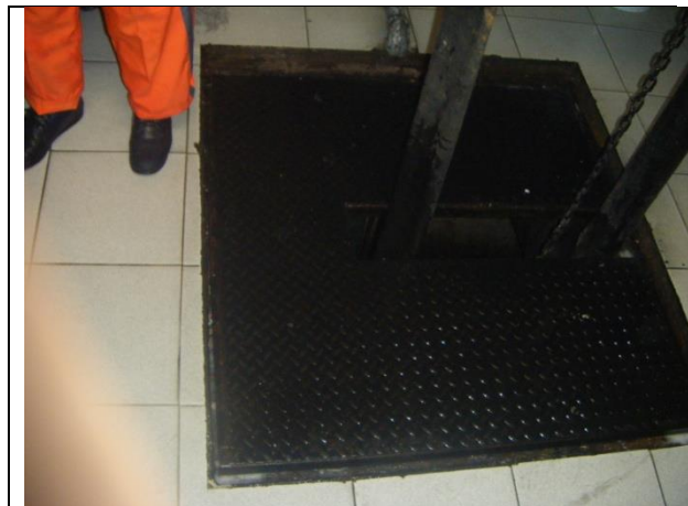
Sustitución de las tuberías de descarga y arreglo hidráulico