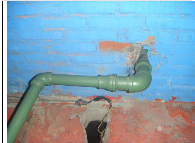
Sustitución de las tuberías de descarga y arreglo hidráulico