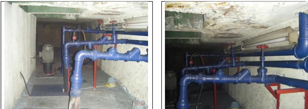
Sustitución de las tuberías de descarga y arreglo hidráulico

NOTA: aforo de aportación de agua al cárcamo solo escurrimiento, pero durante la época de lluvias se incrementa considerablemente