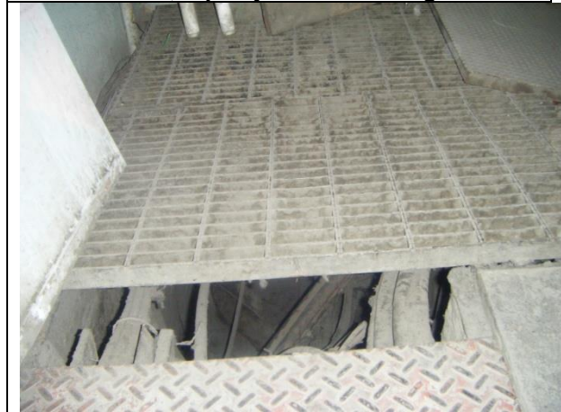
Sustitución de los cableados de alimentación trifásica a 220 volts, más un hilo de tierra, desde la subestación eléctrica hasta el tablero de control y fuerza.