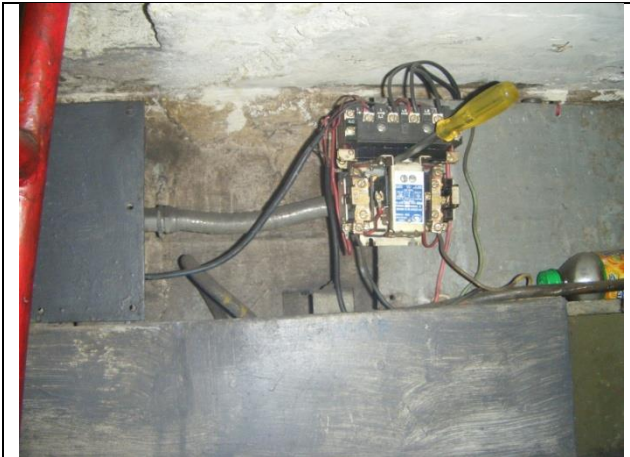
Sustitución de tablero de control y fuerza y las tuberías conduit en la sala de máquinas