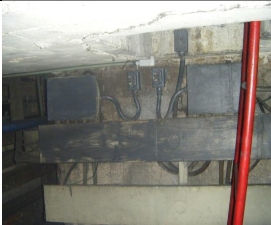
Sustitución de tablero de control y fuerza