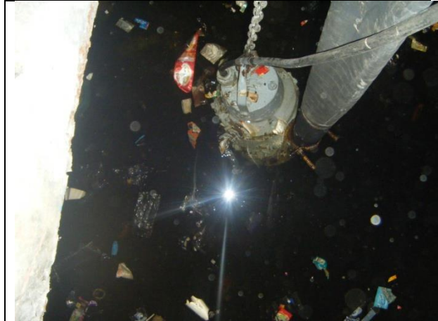
Sustitución de: motobombas, mangueras, soportes para tuberías de descarga y arreglo hidráulico; tapas y marcos de registros