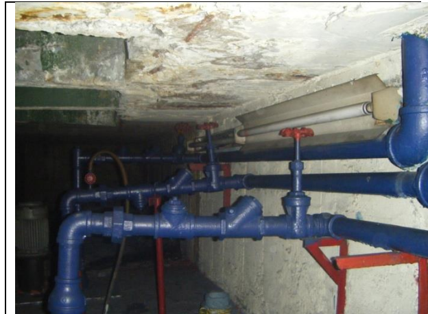
Instalación de 2 gabinetes de alumbrado