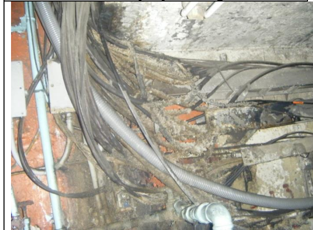
Sustitución de los cableados de alimentación trifásica a 220 volts, más un hilo de tierra, desde la subestación eléctrica hasta el tablero de control y fuerza.