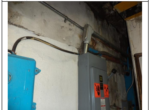
Sustitución de los cableados de alimentación trifásica a 220 volts, más un hilo de tierra, desde la subestación eléctrica hasta el tablero de control y fuerza.