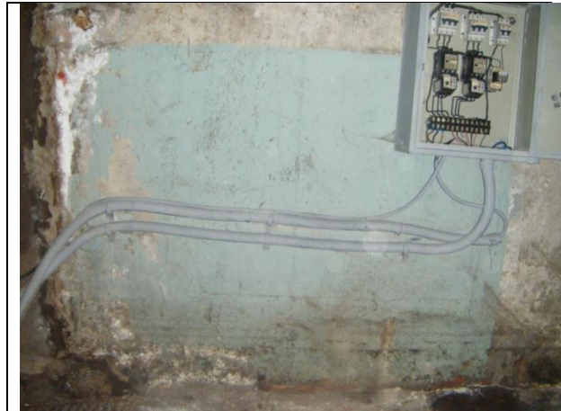
Instalación de tubo conduit para alojar los cables de alimentación y control