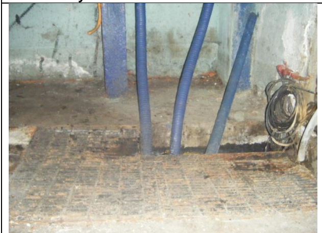
Sustitución de: mangueras; soportes para tuberías de descarga y arreglo hidráulico; marcos y rejilla irving