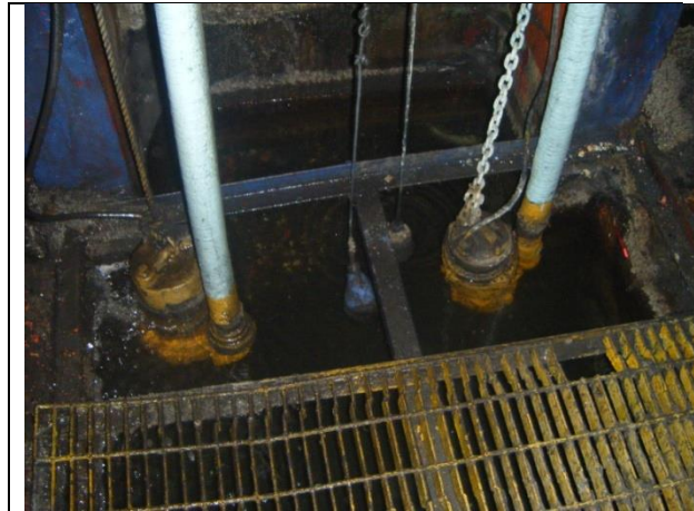
Sustitución de: mangueras; soportes para tuberías de descarga y arreglo hidráulico; marcos y rejilla irving