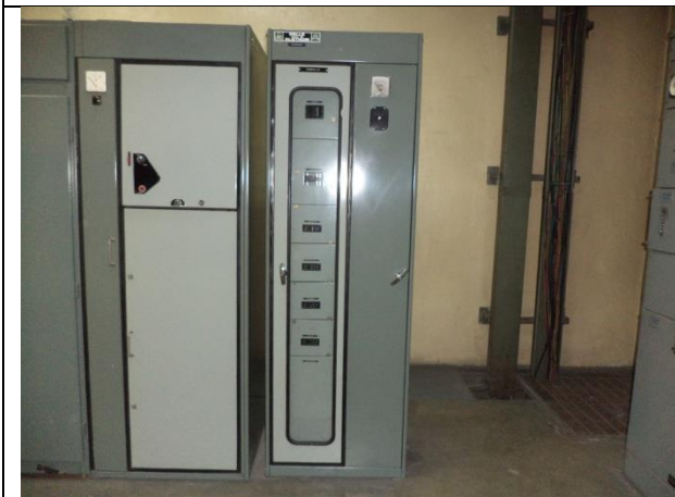
Sustitución del centro de control de motores y transferencia automática en la subestación eléctrica, instalando un tablero de distribución en donde se encuentren todos los interruptores de los equipos de bombeo de la estación "TABLERO F", con alimentación PREFERENCIAL.