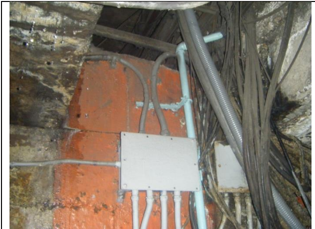
Sustitución de tablero de control y fuerza