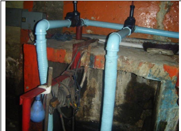
Sustitución de las tuberías de descarga y arreglo hidráulico