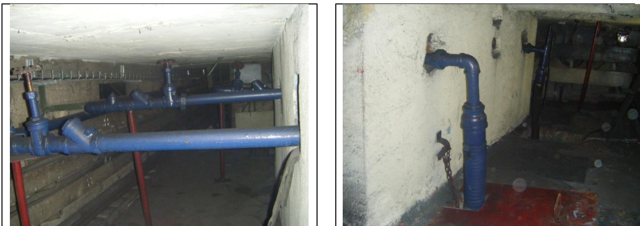
Sustitución de las tuberías de descarga y arreglo hidráulico

NOTA: aforo de aportación de agua al cárcamo 7.8 litros/minuto , pero durante la época de lluvias se incrementa considerablemente