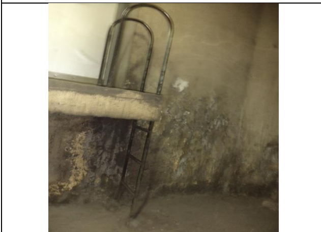
Instalación de escalera de acceso de nivel anden al cuarto de máquinas del extractor y