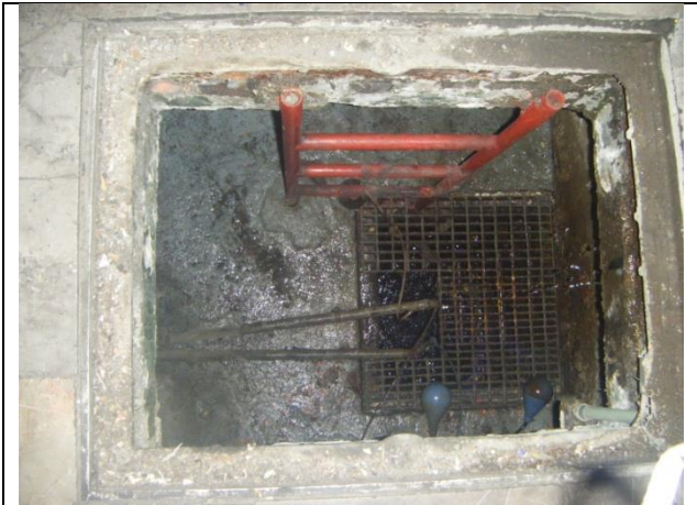
Instalación de escalera para acceso al cárcamo