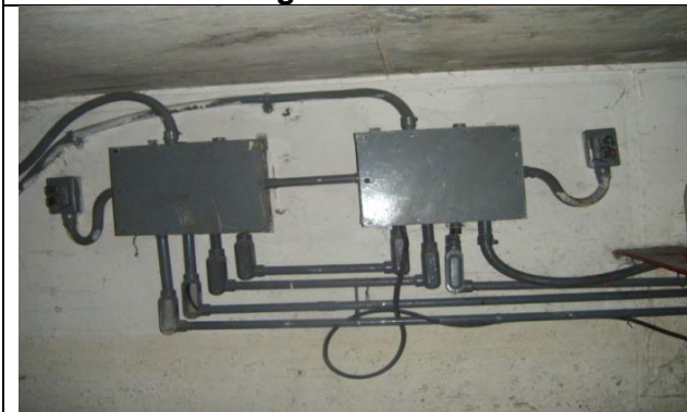
Sustitución de tablero de control y fuerza