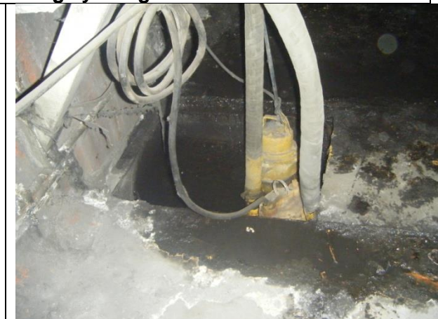
Sustitución de: mangueras; soportes para tuberías de descarga y arreglo hidráulico; marcos y rejilla irving