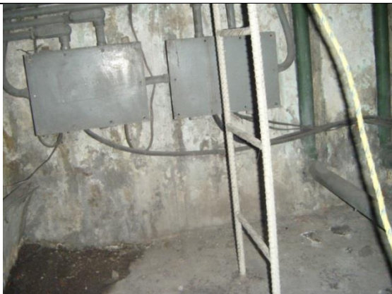
Sustitución de escaleras marinas, instalando escaleras fabricada en acero inoxidable