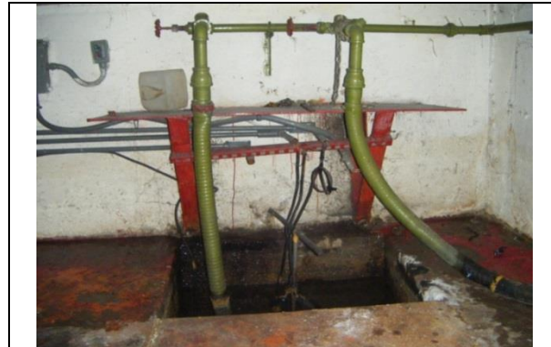
Instalación de tubo conduit para alojar los cables de alimentación y control