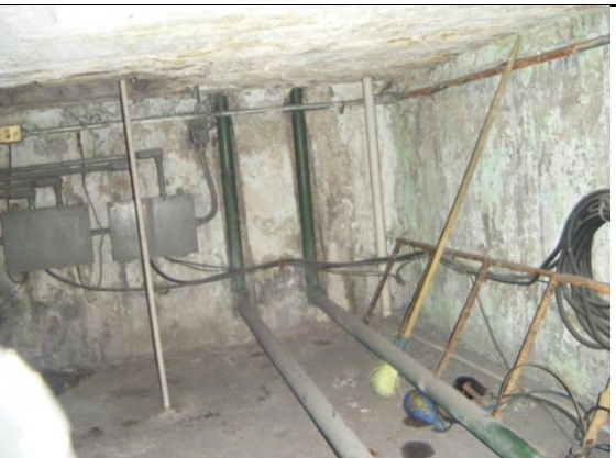
Sustitución de las tuberías conduit en la sala de máquinas.