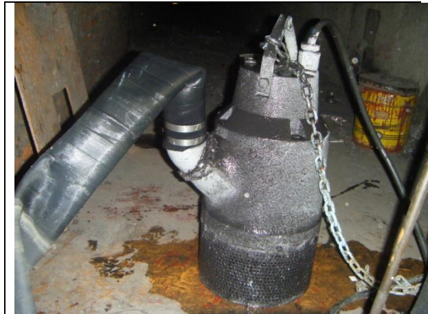
Sustitución de: motobombas, mangueras, soportes para tuberías de descarga y arreglo hidráulico; tapas y marcos de registros