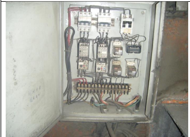
Sustitución de tablero de control y fuerza