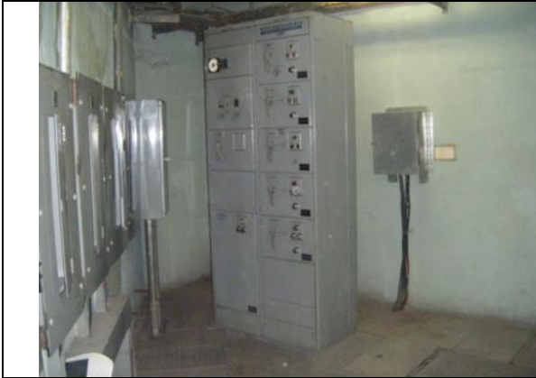
Sustitución del centro de control de motores y transferencia automática en la subestación eléctrica, instalando un tablero de distribución en donde se encuentren todos los interruptores de los equipos de bombeo de la estación "TABLERO F", con alimentación PREFERENCIAL.