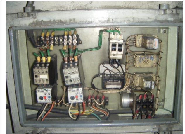
Sustitución de tablero de control y fuerza