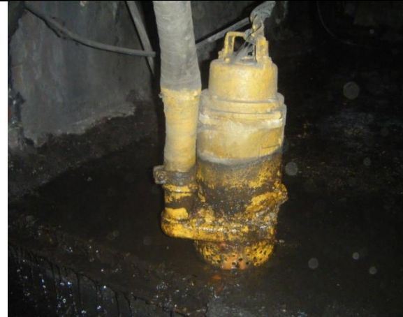
Instalación de motobomba