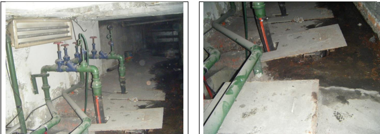
Sustitución de las tuberías de descarga y arreglo hidráulico

NOTA: aforo de aportación de agua al cárcamo 7.8 litros/minuto , pero durante la época de lluvias se incrementa considerablemente