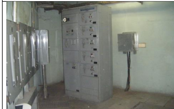
Sustitución del centro de control de motores y transferencia automática en la subestación eléctrica, instalando un tablero de distribución en donde se encuentren todos los interruptores de los equipos de bombeo de la estación "TABLERO F", con alimentación PREFERENCIAL.