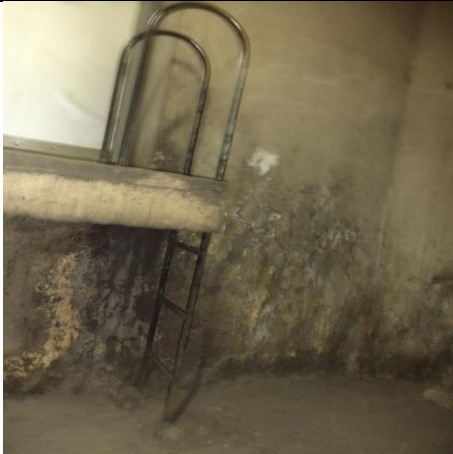
Instalación de escalera de acceso de nivel andén al cuarto de máquinas del extractor