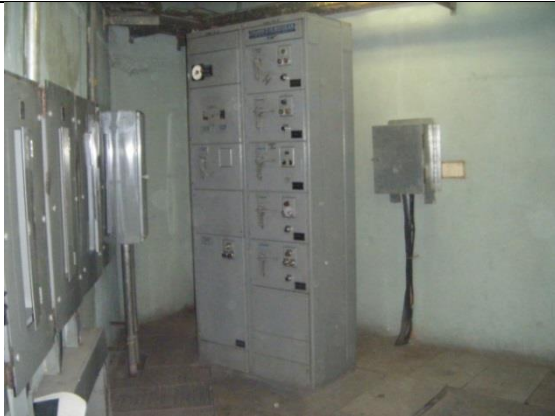
Sustitución del centro de control de motores y transferencia automática en la subestación eléctrica, instalando un tablero de distribución en donde se encuentren todos los interruptores de los equipos de bombeo de la estación "TABLERO F", con alimentación PREFERENCIAL.