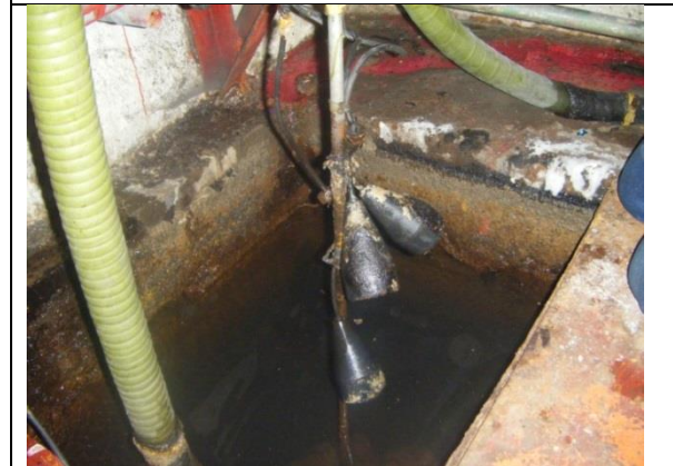
Sustitución de: mangueras; soportes para tuberías de descarga y arreglo hidráulico; marcos y rejilla irving