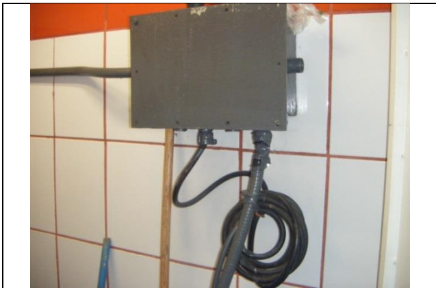
Sustitución del tablero de control y fuerza