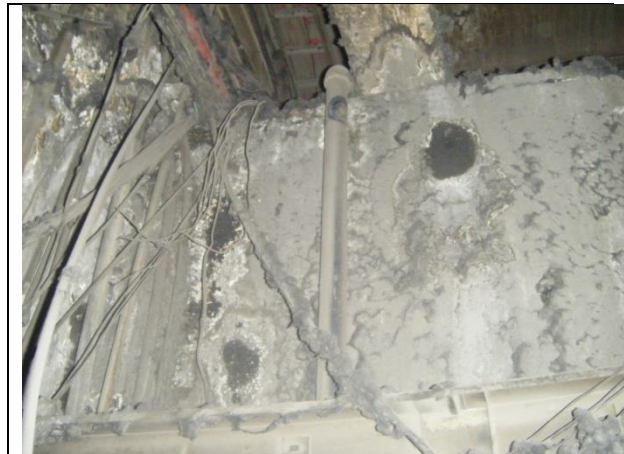
Sustitución de las tuberías de descarga y arreglo hidráulico