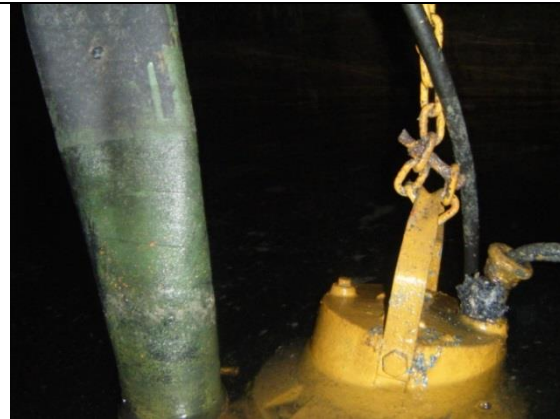
Sustitución de: bombas, mangueras; soportes para tuberías de descarga y arreglo hidráulico; tapas y marcos de registros