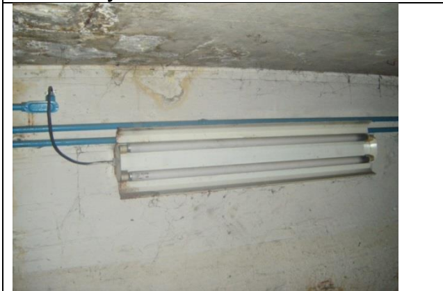
Instalación de gabinetes de alumbrado cesca del cárcamo