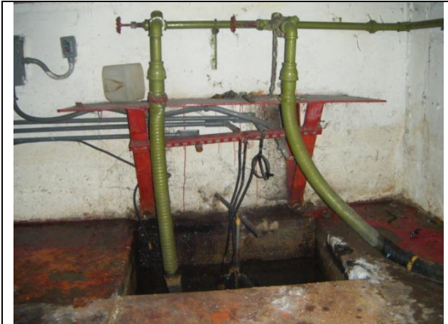
Sustitución de las tuberías de descarga y arreglo hidráulico

NOTA: aforo de aportación de agua al cárcamo escurrimiento , pero durante la época de lluvias se incrementa considerablemente