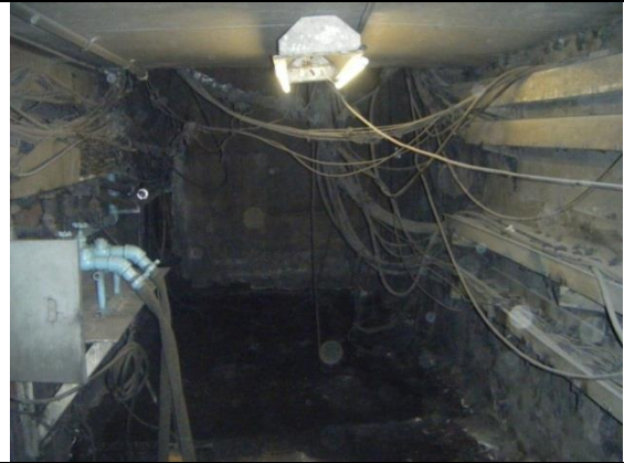
Sustitución de los cableados de alimentación trifásica a 220 volts, más un hilo de tierra, desde la subestación eléctrica hasta el tablero de control y fuerza.