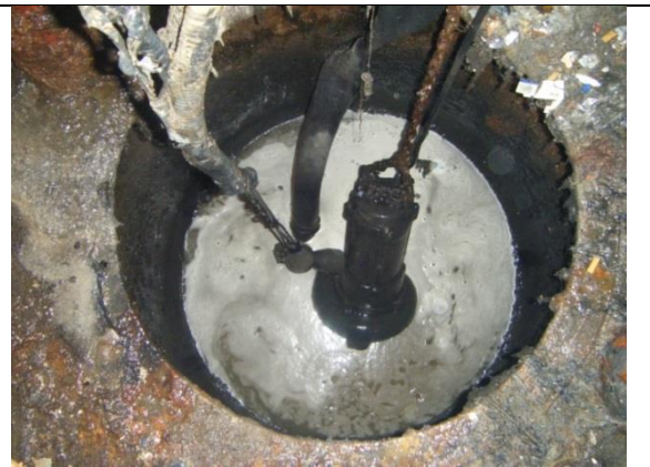
Sustitución de las motobombas, retirando el tanque metálico y tapas de acceso al cárcamo