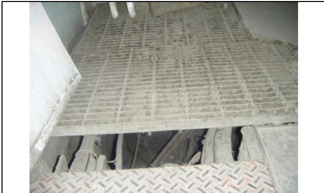
Sustitución de los cableados de alimentación trifásica a 220 volts, más un hilo de tierra, desde la subestación eléctrica hasta el tablero de control y fuerza.