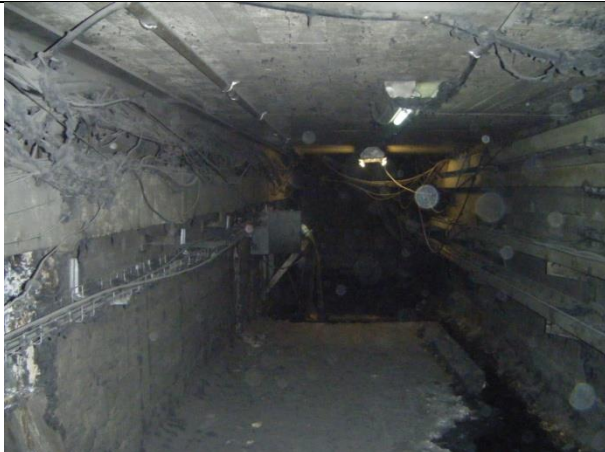
Instalación de 3 gabinetes de 2 x 32 W y 4 gabinetes de 2 x 72 W