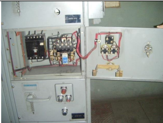
Sustitución de tablero de control y fuerza