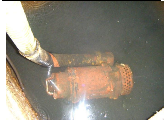
Instalación de motobombas