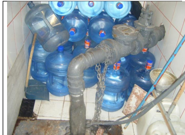
Sustitución de las tuberías de descarga y arreglo hidráulico