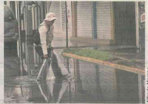
Varias calles y avenidas quedaron encharcadas, lo que complicó la circulación.