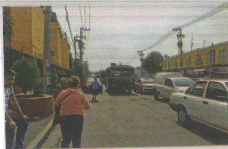
El corredor verde sólo fue habilitado en el tramo de Insurgentes hasta Av. Universidad.

tre 80 y 100 unidades con un presupuesto de 4 mil millones de pesos. Cada unidad tiene un costo de 400 mil a 700 mil dólares.