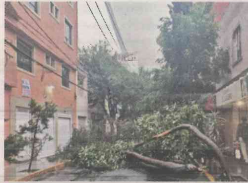
La tormenta dejó árboles caídos, como en la Avenida del Rosal, en Iztapalapa.

“Estamos sobrellevándolas, (pero) las lluvias están