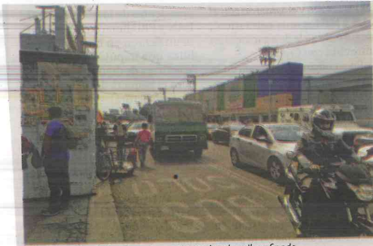
Ante la falta de señalizaciones, los autos invaden el carril confinado.