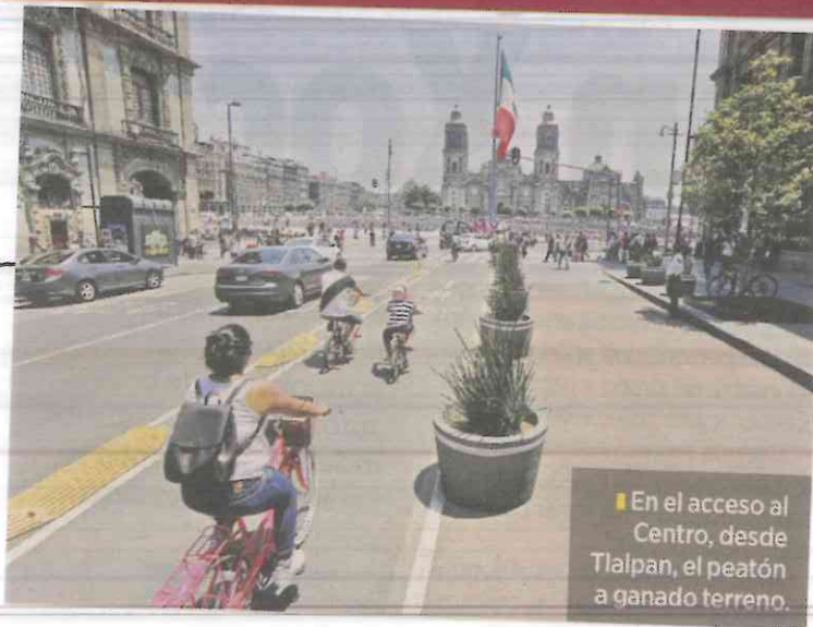
■ En el acceso al Centro, desde Tlalpan, el peatón a ganado terreno.