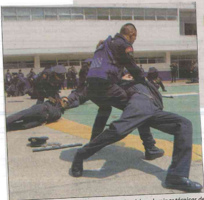
Además de la carrera policial los uniformados deben dominar técnicas de sometimiento y defensa personal.

Actualmente, la PBI es el agrupamiento que más participa en las diferentes etapas del nuevo Sistema de Justicia Penal