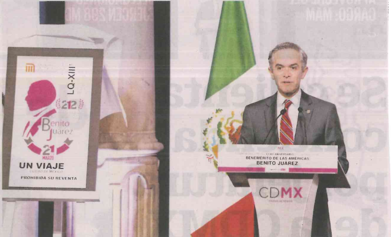
El mandatario local presentó el boleto de Metro por el aniversario del ex presidente Benito Juárez.