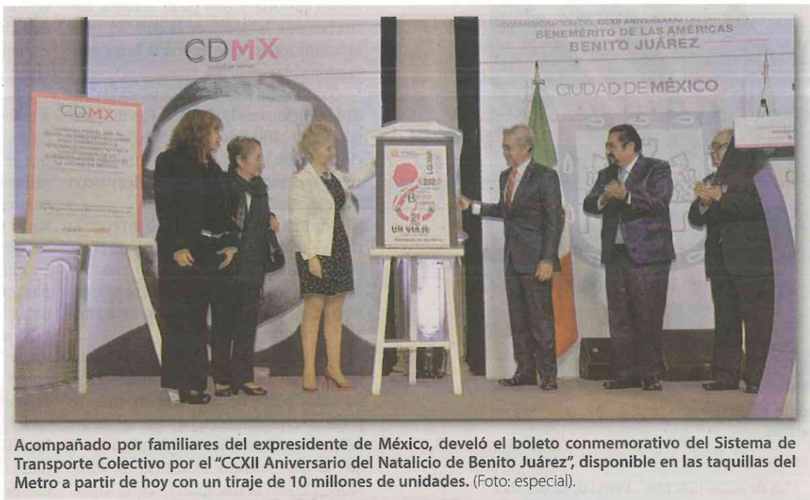
Acompañado por familiares del expresidente de México, develó el boleto conmemorativo del Sistema de Transporte Colectivo por el "CCXII Aniversario del Natalicio de Benito Juárez", disponible en las taquillas del Metro a partir de hoy con un tiraje de 10 millones de unidades. (Foto: especial).