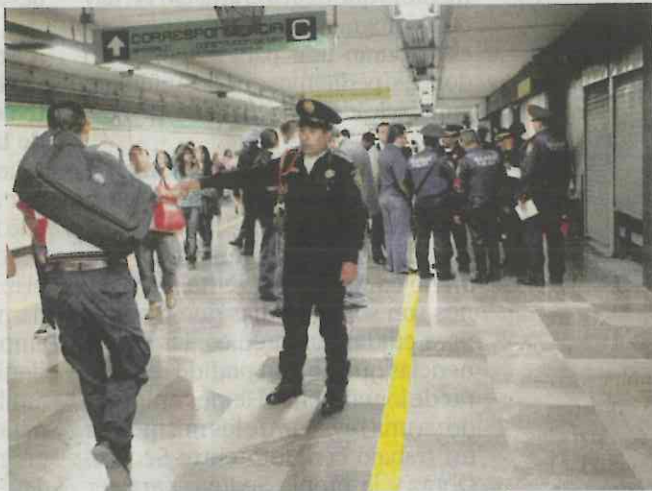
Los sujetos fueron detenidos cuando despojaban a usuarios del Metro de sus celulares, uno de ellos en Bellas Artes.

AÑOS de prisión podrían alcanzar los hombres detenidos en el Metro por robo simple.