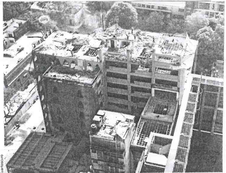
Cuantificar el daño a las familias.

De los costos monetarios que para la CDMX tuvo el operativo de emergencia, advierte: “Mira, son despliegues muy grandes. Simplemente el sobrevuelo de los helicópteros, el despliegue de todas las patrullas, ambulancias, bomberos... El despliegue fue muy importante. Obviamente no habría manera siquiera de intentar una cuantificación. Pero hay algo muy importante: ¡el despliegue de la sociedad civil! ¡De verdad, importantísimo! Cada quien ayudaba de la manera como pensaba que podía hacerlo ante los llamados de