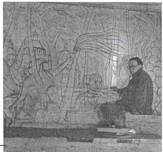
Diego Rivera pintando el mural Sueño de una tarde dominical en la Alameda Central, 1947 Reproducción contemporánea

Desde hace más de cuatro siglos, la Alameda Central de la Ciudad de México ve pasar el tiempo en silencio, como un oasis verde entre el desierto gris. Rodeada por asfalto inmóvil, otrora caminos de agua; entre automóviles, rascacielos, monumentos de mármol, templos novohispanos, fuentes porfirianas, Bellas Artes y el quemadero inquisitorial de San Diego, pocos son los lugares en el mundo que pueden contar historias como nuestro jardín más antiguo. Consciente de tal prodigio, Diego Rivera no dudó mucho en considerar la Alameda Central como el escenario idóneo para realizar la magna tarea de condensar, en una imagen, la historia nacional y el crisol de sus simbolismos: el Sueño de una tarde dominical en la Alameda Central.