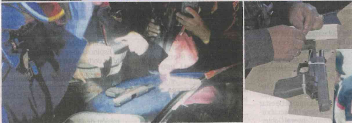
Cerca de las 22:25 horas del viernes pasado, usuarios de la estación Tacuba reportaron que una persona había efectuado un disparo en el vagón.