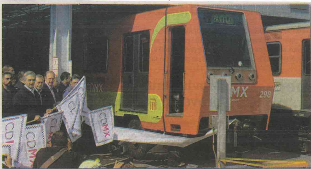
El jefe de gobierno capitalino, Miguel Ángel Mancera, dio el banderazo de salida de los cuatro trenes rehabilitados, los cuales serán para las líneas 2, 5, 9 y "B" del STC Metro.