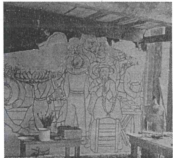
Reproducciones contemporáneas

EL SUEÑO, CONGRUENTE CON SU NATURALEZA, ENGALANABA EL LUJOSO VESTÍBULO DEL NO MENOS OPULENTO HOTEL DEL PRADO.