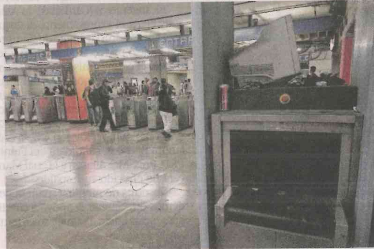
Los aparatos detectores de metales colocados en el Metro se encuentran abandonados, incluso la gente los aprovecha para dejar ahí su basura.