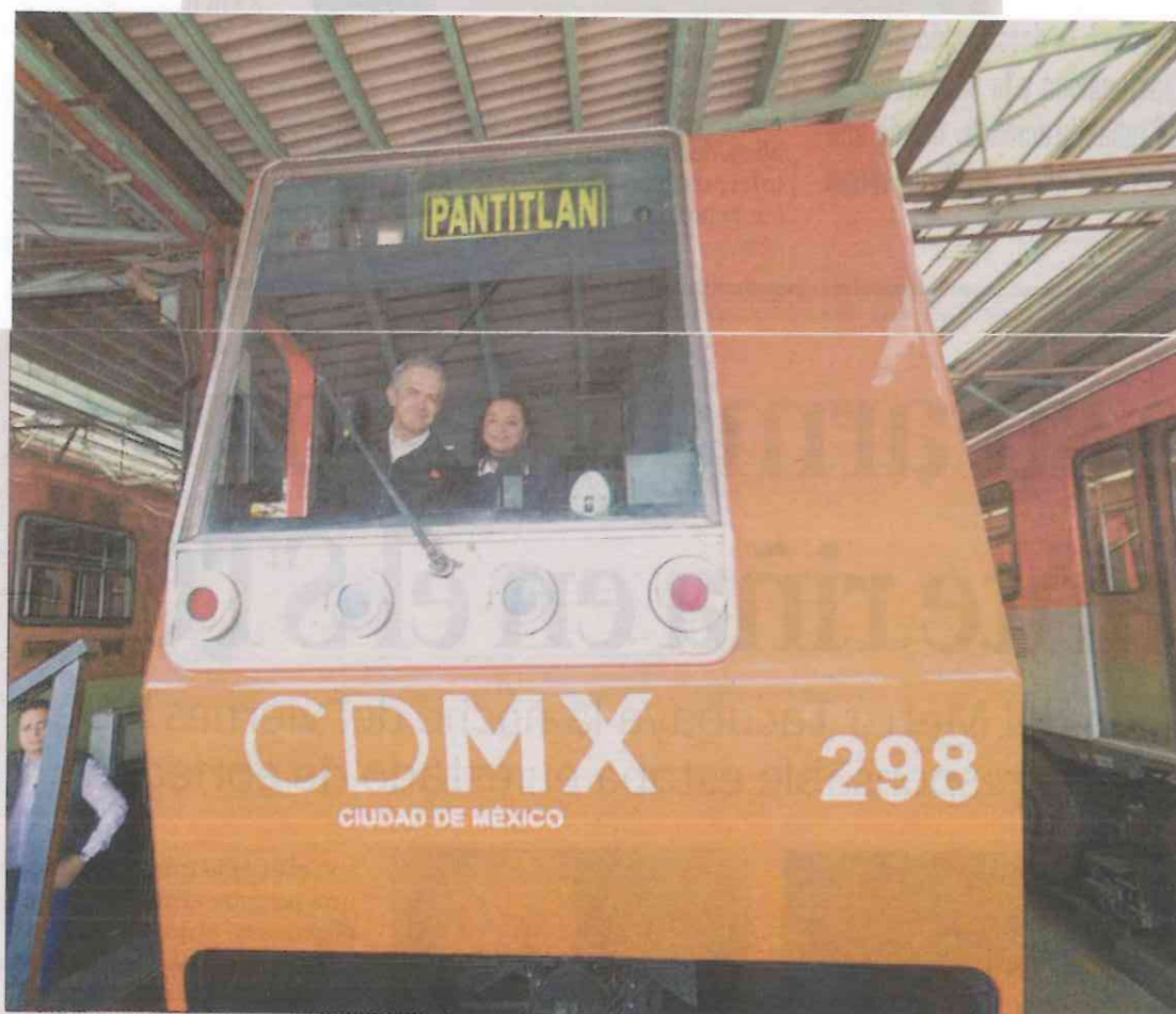
Autoridades capitalinas inauguraron el espacio del Conacyt donde investigadores e ingenieros mexicanos desarrollan tecnologías para mejorar el servicio.

“Aquí ya tenemos nuestro museo, aquí estamos haciéndolo con nuestro sabor, con nuestro estilo, pero estoy seguro que la gente que venga de fuera, cuando tengamos más estaciones intervenidas, se va a sorprender con esto”, expresó.