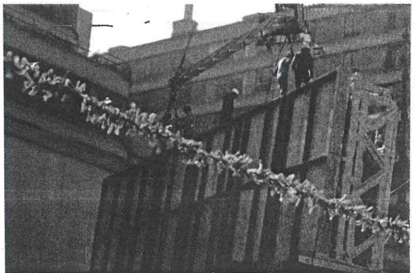
Tomás Zurián. Movimiento del mural, diciembre de 1986 Reproducciones contemporáneas

“Hace falta mucho por profundizar en la labor de Diego; cada acercamiento abre una nueva línea de investigación, aunado a que un solo personaje del mural da para una muestra completa. Es un lugar inagotable, estamos seguros de que cada persona que viene se encuentra con algo que no conocía y además se apropia de su historia. El mural es un espacio que está vivo y la gente se lleva su corazón.”