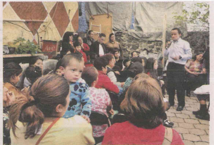
El ex titular del IMSS se reunió con vecinos de Bosques del Pedregal.

criticó los problemas de movilidad en la zona, los cuales afectan las actividades de los residentes por la falta de variantes.