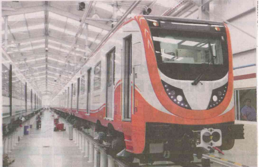
Las unidades nuevas serán de rodadura neumática y cada una está compuesta por nueve coches, ofreciendo así una capacidad de transporte de alrededor de 2 mil usuarios.

“Se están haciendo las pruebas de factoría, esto es para comprobar que los sistemas están operativos”