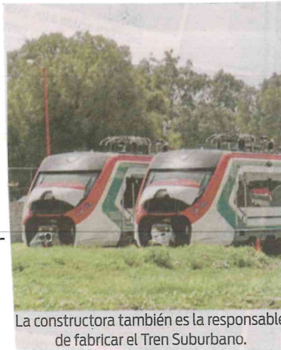
La constructora también es la responsable de fabricar el Tren Suburbano.

Años lleva operando el Sistema de Transporte Colectivo Metro.