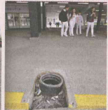
■ Aún hay desperfectos físicos o de funcionamiento.

y sólo los módulos de baños dan servicio al público parcialmente.