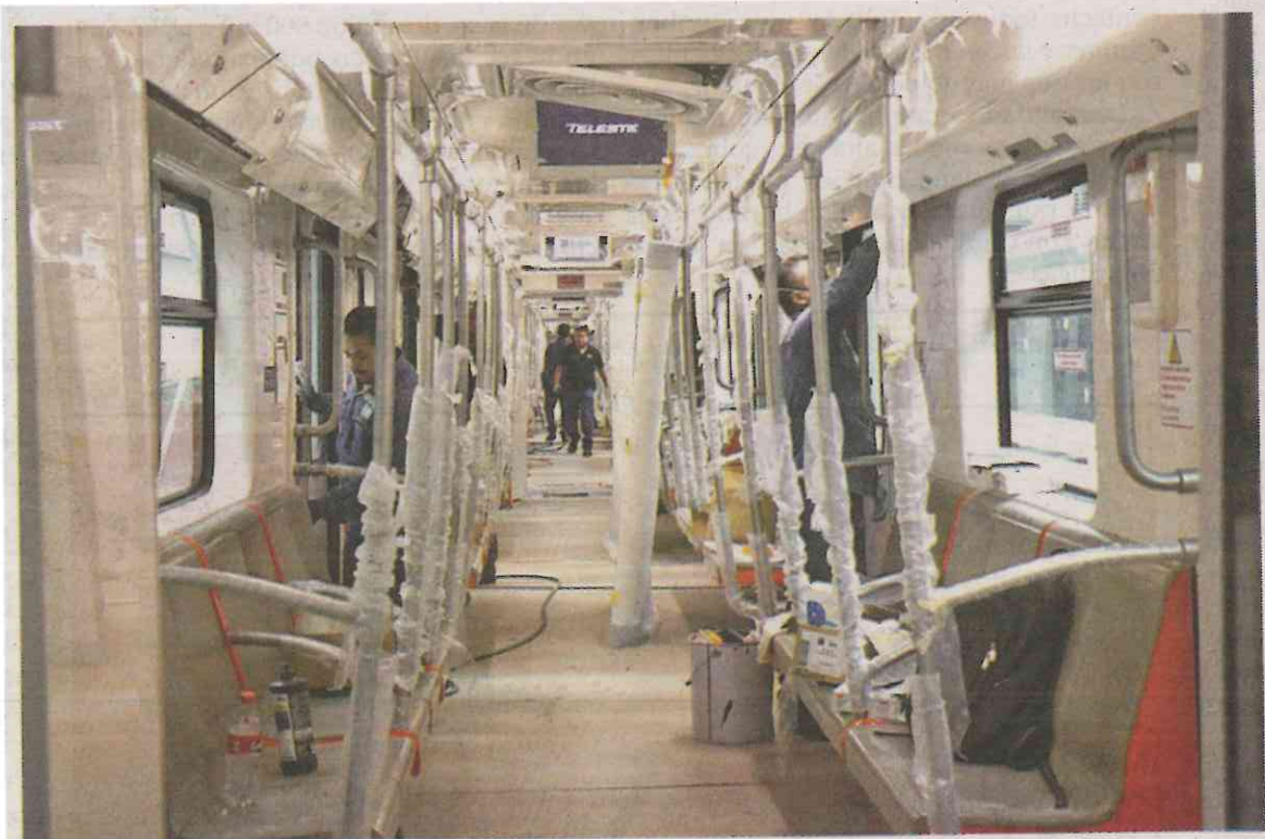
El proceso de ensamblado inicia con las cajas de los vagones, continúa con los interiores, las cabinas de conducción y posteriormente con la instalación de equipos de iluminación y de control.