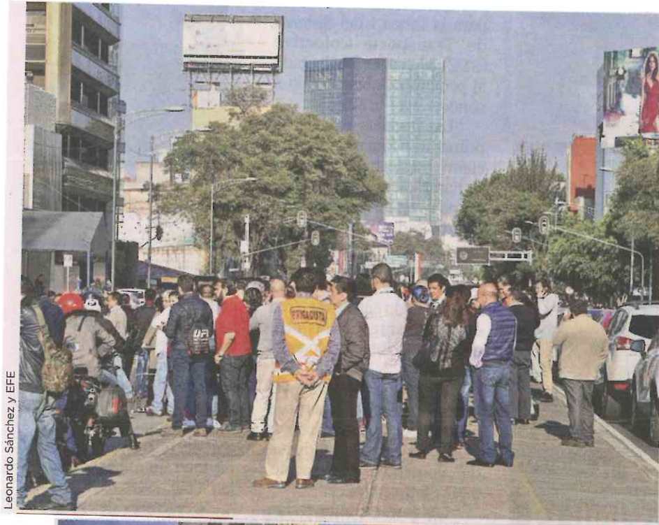
Leonardo Sánchez y EFE