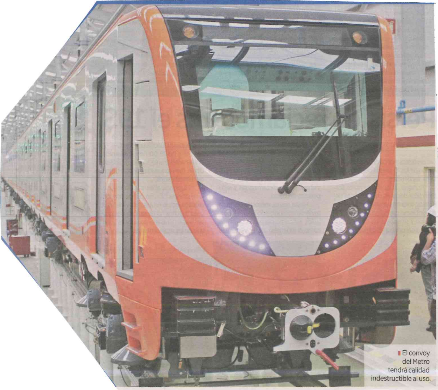
El convoy del Metro tendrá calidad indestructible al uso.