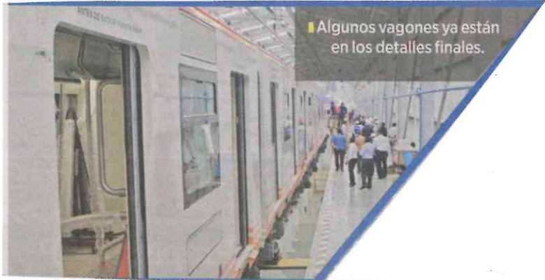
Algunos vagones ya están en los detalles finales.