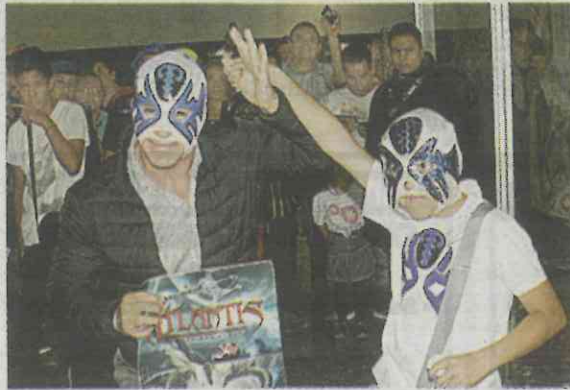
● Su máscara, ya es un ícono de la lucha libre