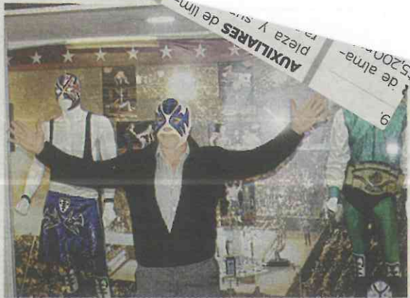
● Objetos del gladiador, adornan la estación Guerrero

Atlantis festejó con una lucha retro en la Arena México en la que compartió esquina con Octagón y el Rayo de Jalisco Jr, dos de sus más grandes parejas, y enfrentó a Fuerza Guerrera, Último Guerrero y Máscara Año 2000.